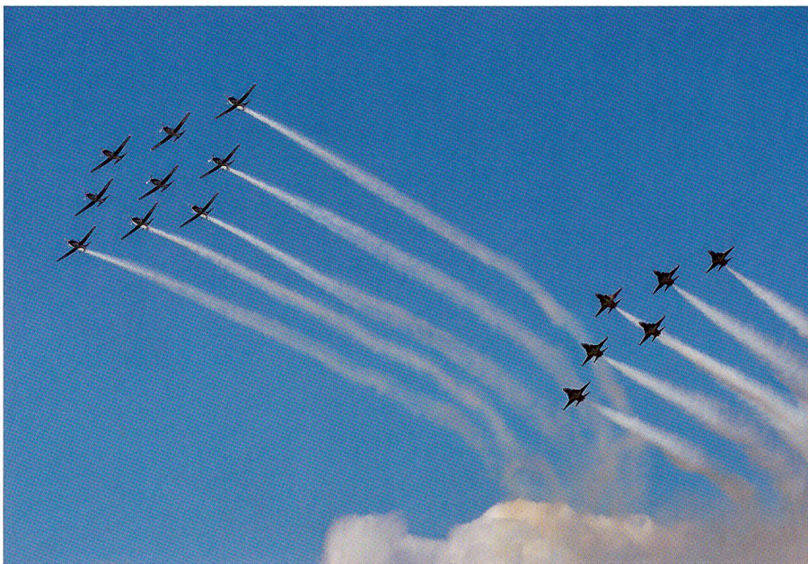
Ein einmaliges Bild von der AIR14: Patrouille Suisse und PC-7-Team gemeinsam!