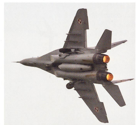
Imposanter Start der polnischen Mig-29.