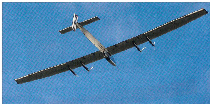
Zum Abschluss startete Solarimpulse 2 zu einem Testflug.