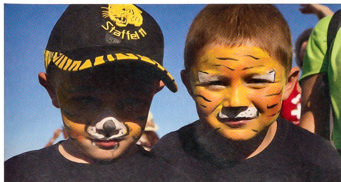
Kinderspass beim Stand der Fliegerstaffel 11.