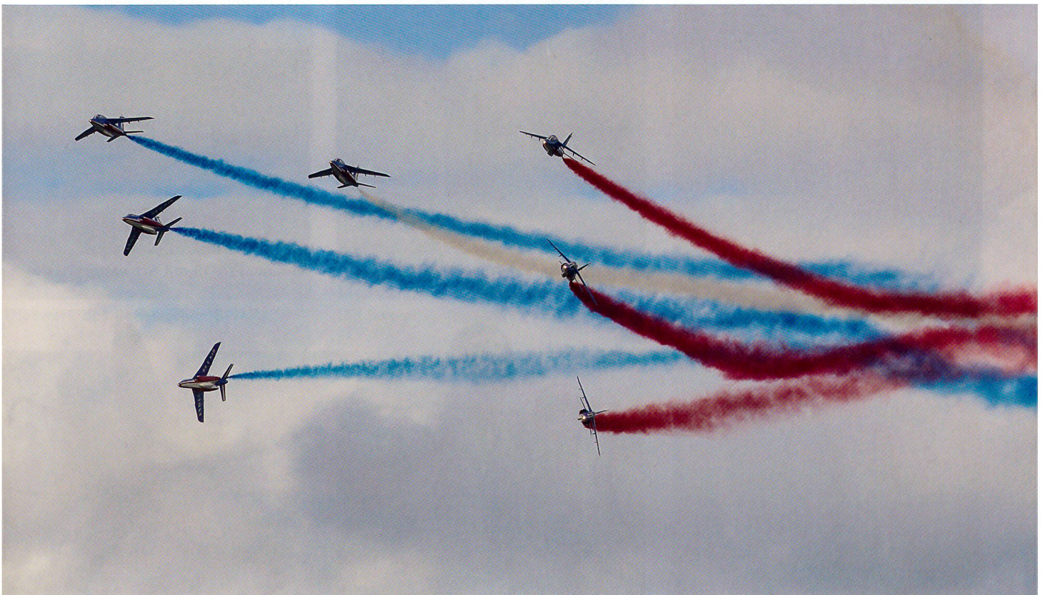
Die Patrouille de France zaubert in ihren Alphajets mit rot-weiss-blauem Rauch Frankreichs Nationalfarben an den Himmel. lw.