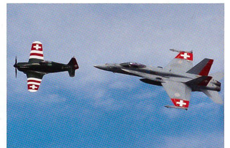
Morane, F/A-18 mit Schweizerkreuzen.