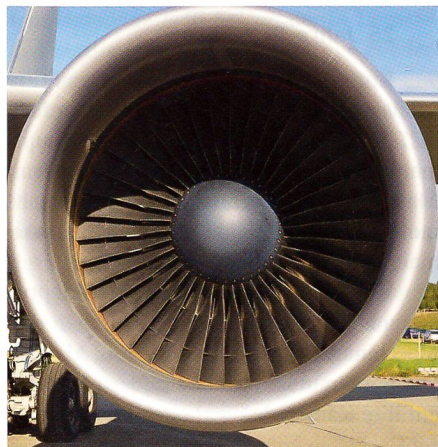
Triebwerk des italienischen B-767.