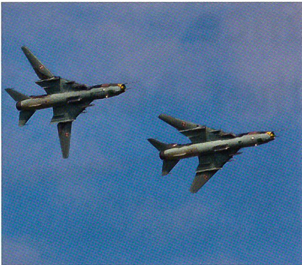
Wie im Kalten Krieg: Suchoi-22, Polen.