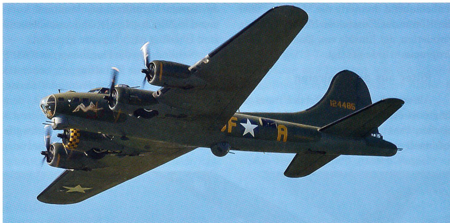
Die legendäre fliegende Festung B-17 Sally B.