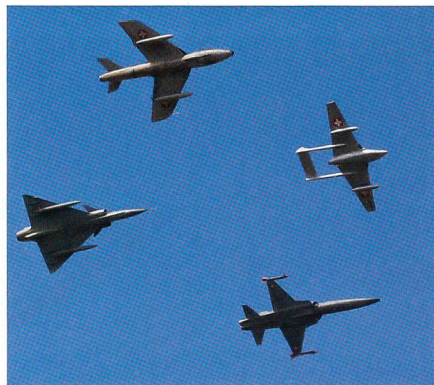
Hunter, Vampire, Mirage, Tiger.