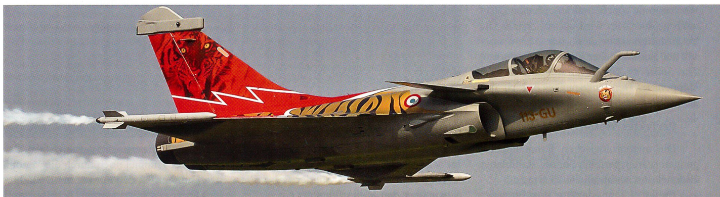
Die französische Rafale zeigte die eindruckliche Vorführung im Tigerlook.