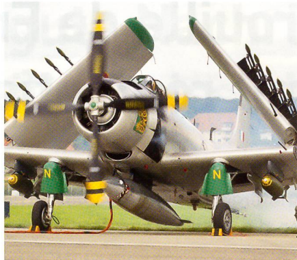
Skyraider bei der Startvorbereitung.