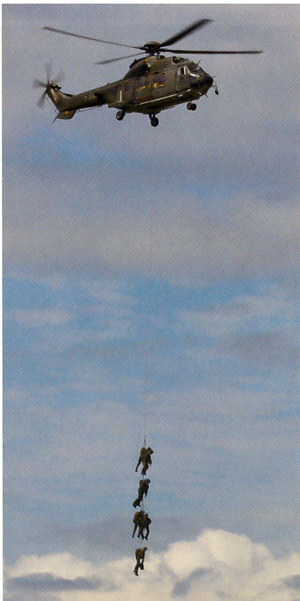
Super Puma mit Sonderkommando.

Peter Forster (fo, Text), Andreas Hess (ah, Text), Hans-Peter-Neuweiler (hpn, Text), und Franz Knuchel (Bild). Für vorbildliche Pressearbeit danken wir Jürg Nussbaum und David Marquis.