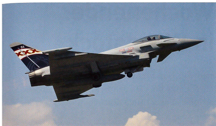
Start des Eurofighters der Royal Air Force.