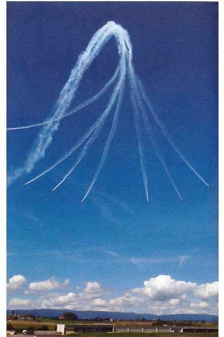
Die Patrulla Aguila aus Spanien.