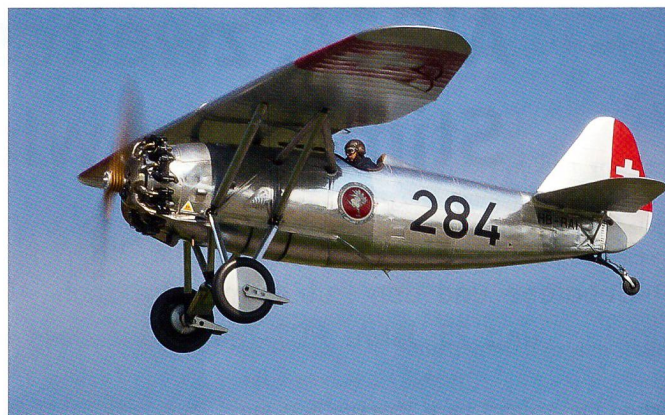
Die schöne Dewoitine D-26.