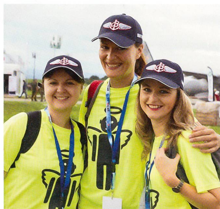
Die helfenden Engel der Air14.