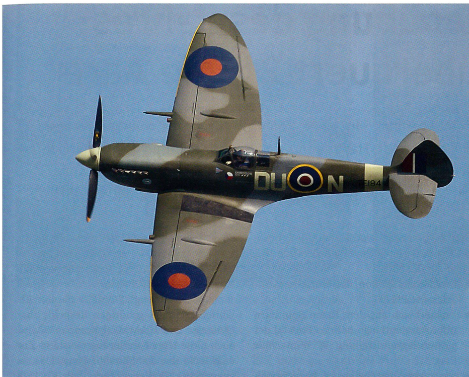
Das britische Jagdflugzeug Spitfire aus dem Zweiten Weltkrieg.

Nachdem zwei Rafale und eine Transportmaschine der französischen Armée de l'Air um 9 Uhr die Startfreigabe für ihren Rückflug zu ihrer Homebase erhalten hatten, fegte eine F-16 Falcon der in Leuwarden stationierten 323. Staffel der Niederländischen Luchtmaacht über die Piste und startete ein atemberaubendes Einzelsdisplay.