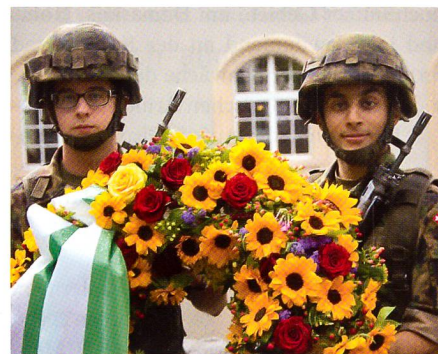
Unteroffiziere mit Blumenkranz.