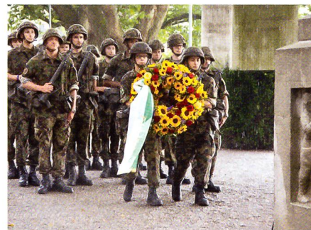
Der Ehrenzug aus der HQ Kp 11/1.