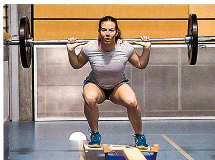
Michelle Gisin im Krafraum.