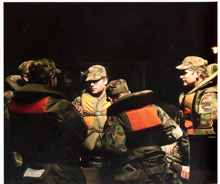
Letzte Absprachen vor dem Verlad der Fahrzeuge.