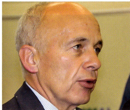
Maurer: «Upgrade F-5 ist undenkbar.»

Auf die Interpellation des Urner CVP-Standesherrn Isidor Baumann antwortete Bundesrat Ueli Maurer im Ständerat wie folgt: «Für uns ist allenfalls denkbar, den F-5 noch einige Jahre für gewisse reduzierte Aufgaben weiter im Einsatz zu lassen, ohne aber Geld für ein Upgrade hineinzustecken.