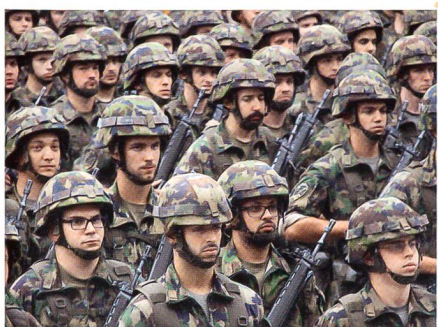
Das Ristl Bat 32: kernig und kompetent.