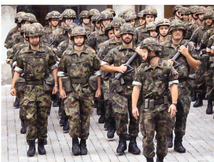
Der Aufmarsch auf dem Goldenen Boden.