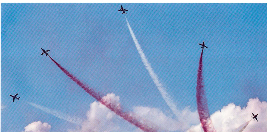
Das Schlussbouquet der grossartigen Red Arrows in den britischen Nationalfarben.