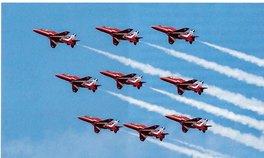
Die britische Spitzenstaffel Red Arrows am strahlend blauen Himmel über Payerne.