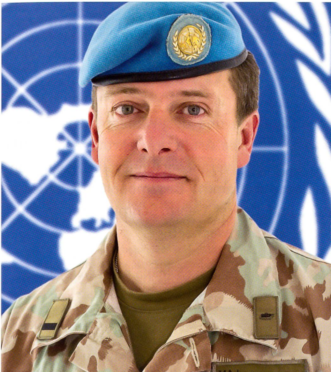
Als UN-Military Observer 9.2011–10.2012, OGG-D (Observer Group Golan, Damascus), hier als Deputy Chief OGG.