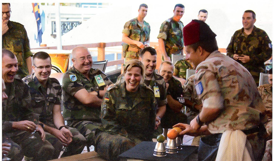
Auftritt im «Swiss House», Camp Filmcity, HQ KFOR, vor Publikum aus der Schweiz, Deutschland, Österreich, Portugal und Frankreich. «Cups & Balls».