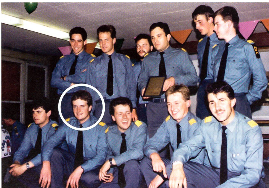
Abverdienen des Leutnantgrades mit höheren Uof, Zfhr und Kp Kdt in Thun.