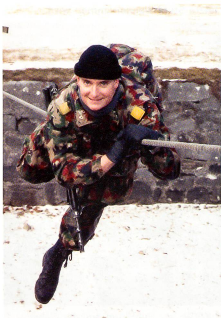
Nahkampfkurs, Luzisteig, Tyrolienne.

Viele Zaubertricks erfindet er selber in seinem Keller. Er führt mich in das unterirdische Gewölbe seines Hauses, in die Mystery-Bar. Ein Raum voller Mystik mit einer Bühne und unzähligen Utensilien. Hier