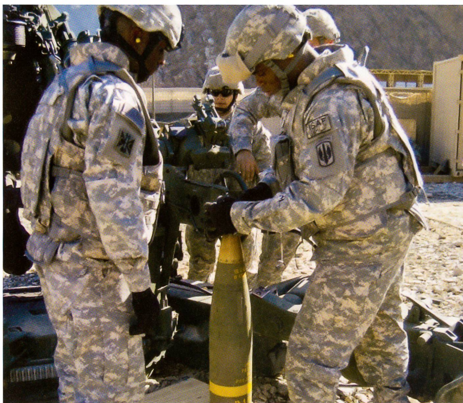
Amerikaner in Afghanistan: Der Tempierer bereitet Excalibur auf den Abschuss vor.

Weil gleichzeitig zur Forderung 1 – höchste Präzision – die Forderung 2 – immense Schussdistanz – trat, mussten die Ingenieure neue Herausforderungen über-