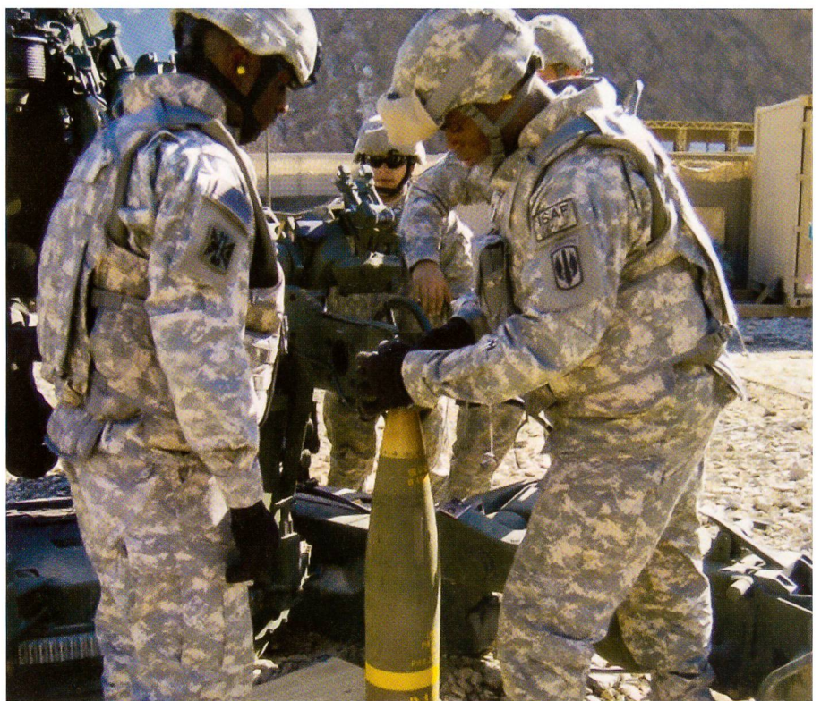
Amerikaner in Afghanistan: Der Tempierer bereitet Excalibur auf den Abschuss vor.

Weil gleichzeitig zur Forderung 1 – höchste Präzision – die Forderung 2 – immense Schussdistanz – trat, mussten die Ingenieure neue Herausforderungen über-