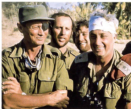
1973: Dayan und Sharon mit Kopfwunde.

Sharons Division erfüllte den schwierigsten Auftrag. Sie durchbrach bei Abu Agheila, wo Sinai-Kriege in aller Regel entschieden werden, die ägyptischen Stellungen. So schuf er die Lage, in der Yoffe