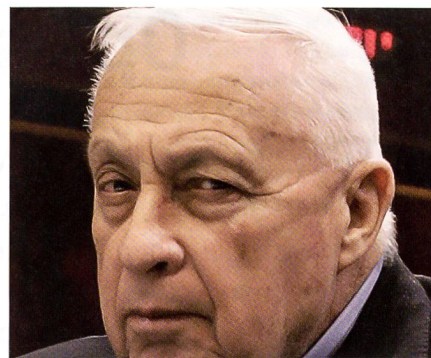
Ende 2005: Zwischen den Schlaganfällen.

Er befand sich auf dem Höhepunkt seines militärischen Ruhmes und berichtete von seinen Plänen. Nachdem der Unter-