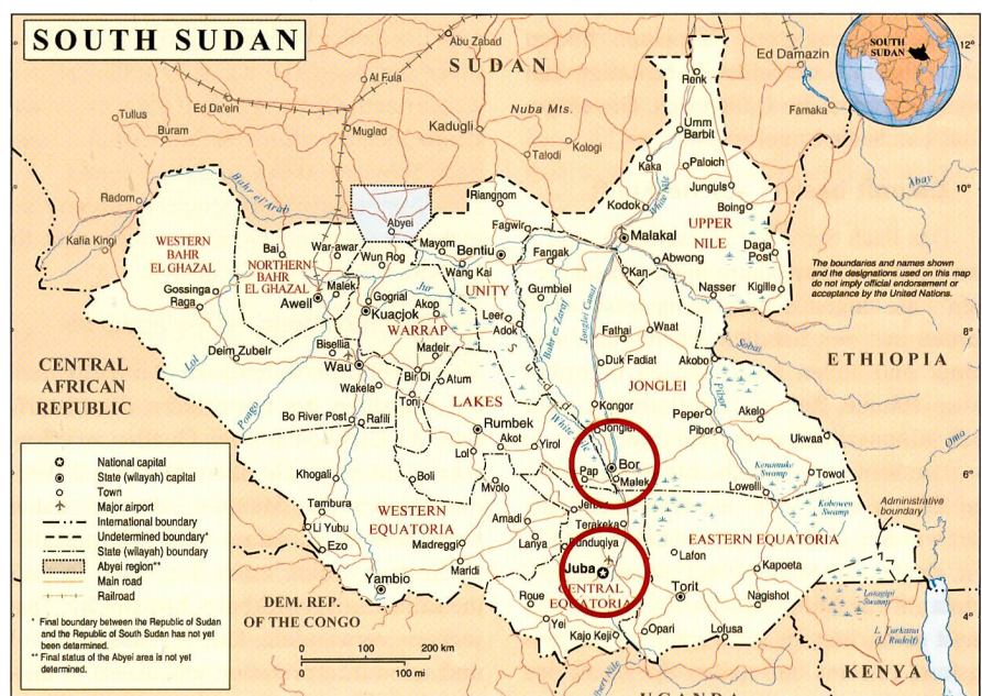
Südsudan mit Juba und Bor am Weissen Nil (nimmt bei Khartum den Blauen Nil auf).

Als drei amerikanische CV-22 Osprey bei Bor amerikanische Staatsbürger evakuierten, gerieten sie unter Beschuss der