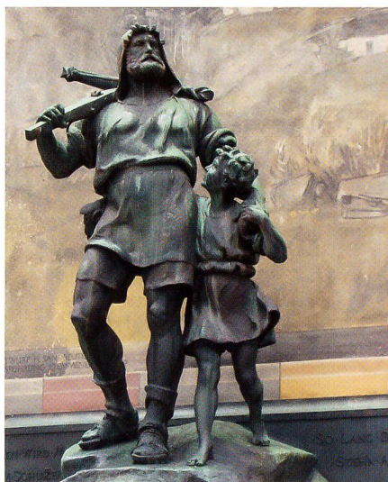
Wilhelm Tell. Das Denkmal in Altdorf.

Alle drei standen für eidgenössische Tugenden: Arnold von Winkelried der opferbereite Held, der das Gesamtwohl über die eigenen Interessen stellt; Wilhelm Tell, der freiheitsdurstige Held und Kunstschütze, der durch Schiller unsterblich geworden ist, und Niklaus von Flüe, der weise Friedensstifter und legendäre Schöpfer des Gedankens der Schweizer Neutralität.