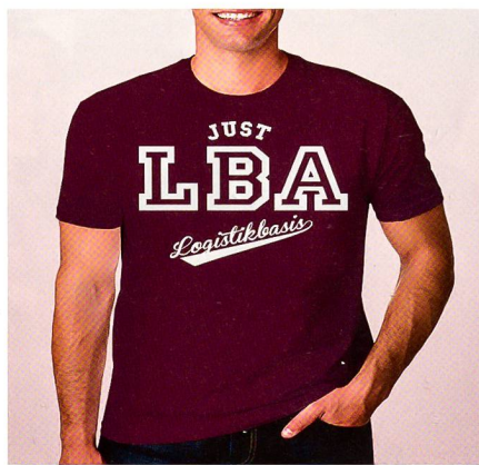
Das neue T-Shirt der LBA.