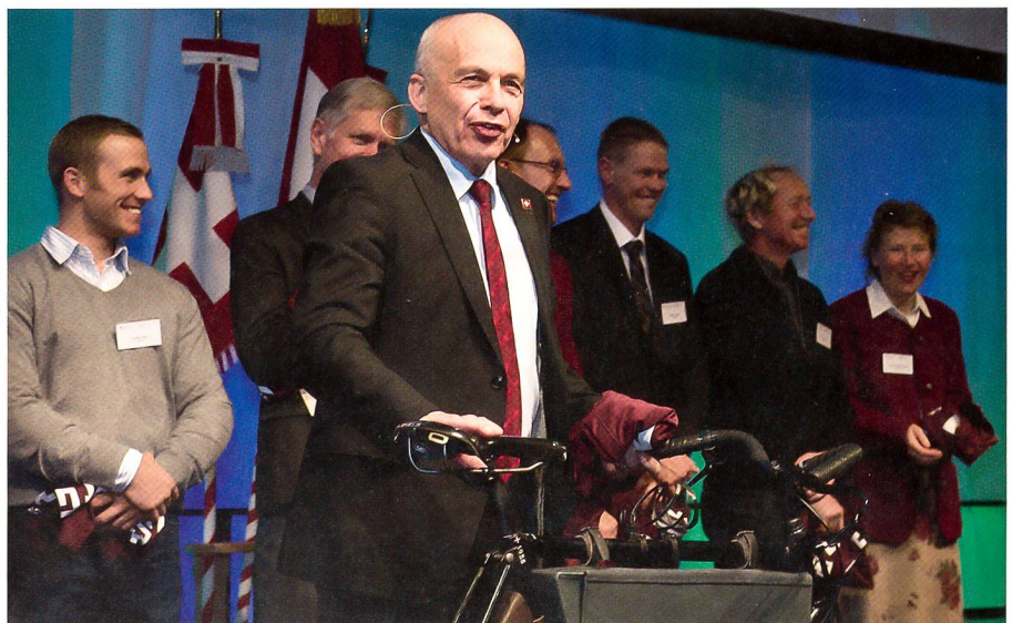
Der Kommandant eines Radfahrerbataillons strahlt: ein richtiges Ordonnanzrad!