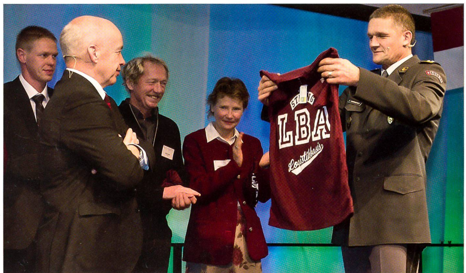
Bundesrat Ueli Maurer, der sportliche Chef VBS, erhält das neue T-Shirt der LBA.