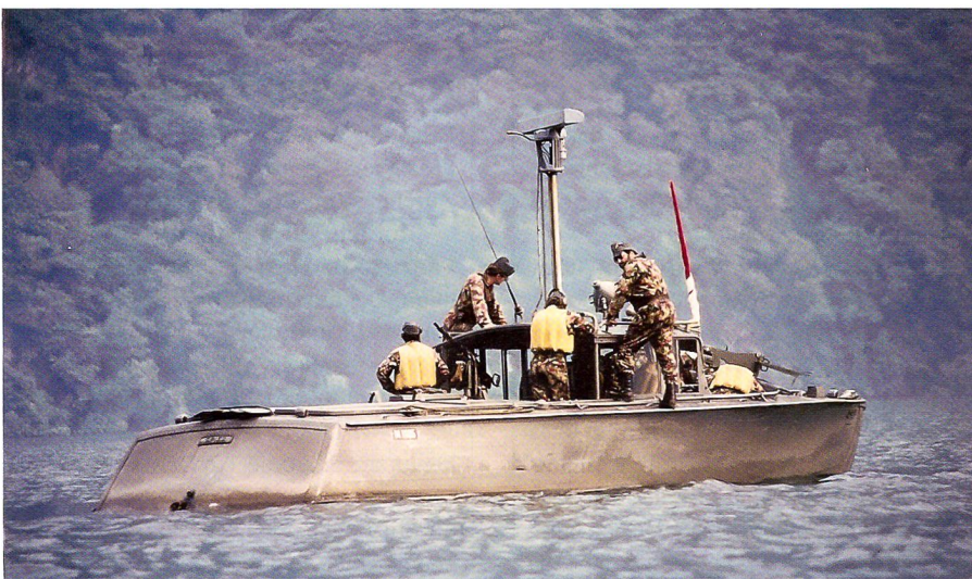
Patrouillenboot 41 anlässlich eines Wiederholungskurses.

Bereits vor dem Zweiten Weltkrieg bestand für das Grenzwachtkorps und die Armee ein Bedarf für bewaffnete Überwachungsboote. Innerhalb der Generalstabsabteilung wurde ab 1938 die Beschaffung