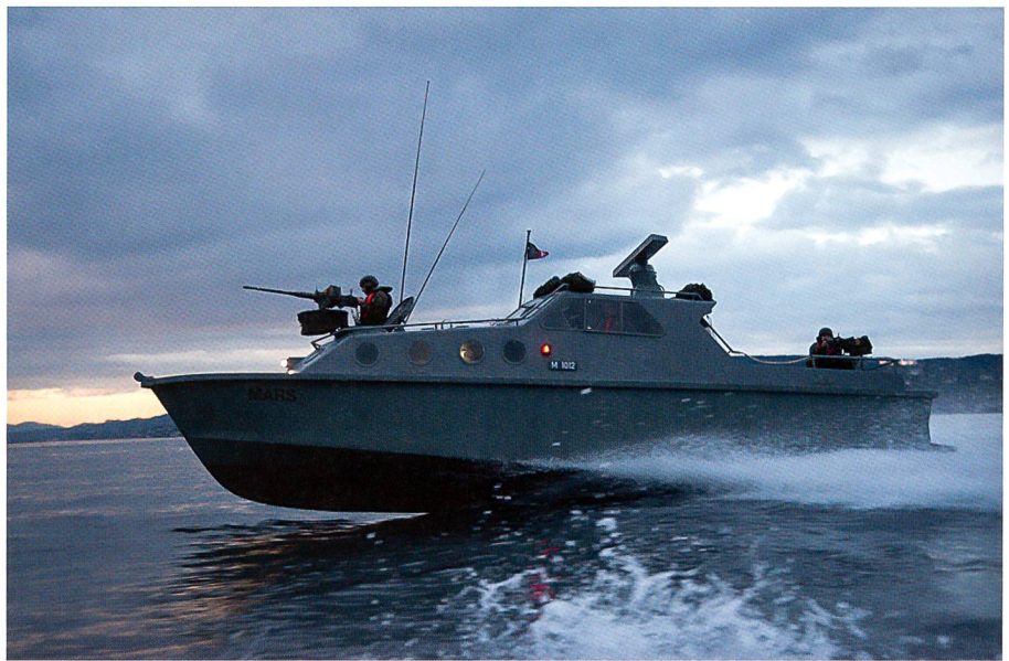
Patrouillenboot 80 im Einsatz während einer Abfangübung.

Am Ufer des Bürgenstocks schoss man bei unterschiedlichen Fahrgeschwindigkeiten mit der mittlerweile montierten 20-mm-Tankbüchse «Solo» und dem Doppel-Maschinengewehr auf verschiedene Bodenziele am Ufer. Die Übernahme des Bootes