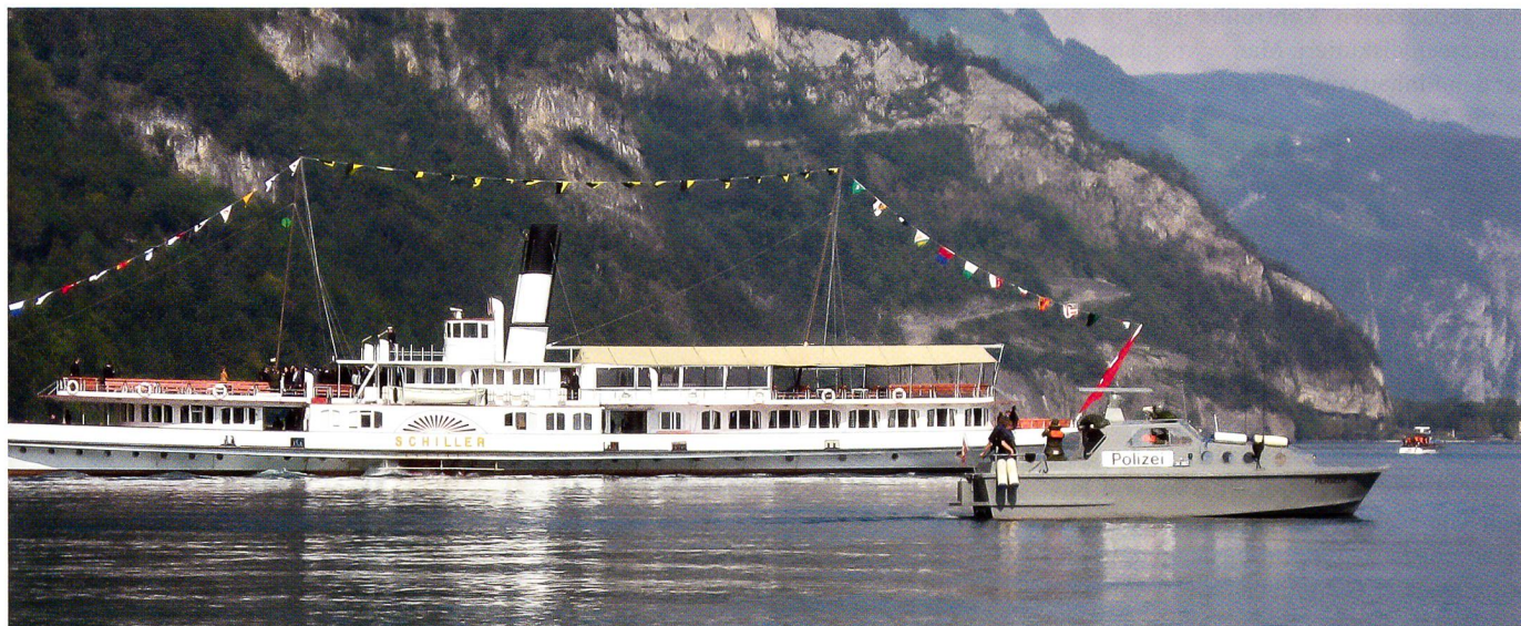
Patrouillenboot auf dem Vierwaldstättersee im Einsatz anlässlich eines Staatsbesuches.

schen Finanzdepartements (EFD) leihweise abgegeben. Sie werden dort für den Grenzpolizeidienst bzw den Zolldienst eingesetzt.