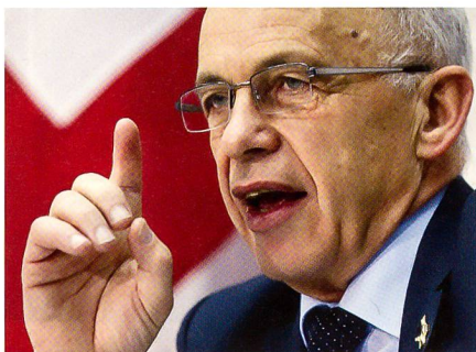
Ueli Maurer: Vorwürfe sind zynisch.

Wir leiden an hohen Betriebskosten, und selbst mit dem neuen Armeeplafond