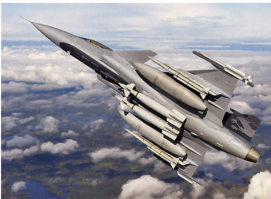
Der Gripen E für die Schweizer Luftwaffe: Die ideale Lösung mit Augenmass.