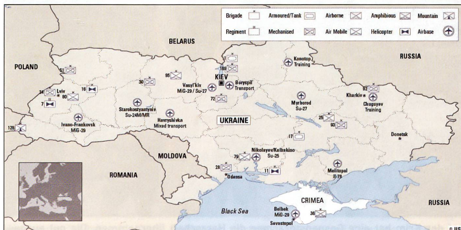
Die militärische Karte des IISS zeigt die Dislokation der ukrainischen Streitkräfte.

Der Kreml beschliesst den Bau einer 4,5 km langen Brücke zwischen Südrussland und der Krim. Das russische Militär-