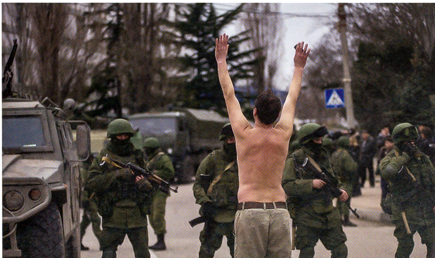
Auf der Krim hat eine Gespensterarmee die Herrschaft übernommen. Die gut ausgerüsteten Soldaten sind vermmummt und tragen keine Hoheits- und Verbandsabzeichen.