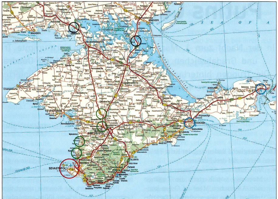
Schwarze Kreise: Russische Strassensperren. Grün: Russisch besetzte Flugplätze und russische Luftwaffenstützpunkte. Rot: Der russische Schwarzmeerflottenstützpunkt Sevastopol. Blau: Russische Truppenstützpunkte. Rote Strassen = Hauptachsen.

Das Parlament der Republik Krim spricht sich mit 78 von 81 Stimmen für den Beitritt zur Russischen Föderation aus. Die Entscheidung gelte sofort, womit ukrainische Soldaten auf der Krim Besatzer wären.