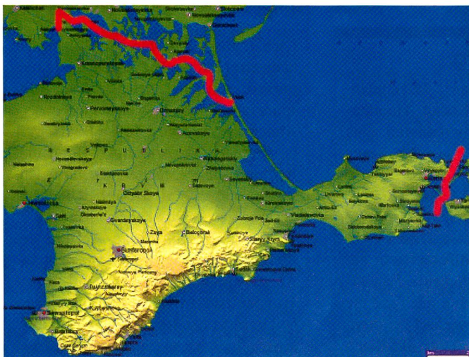
Rot oben die neue Grenze Russland/Ukraine. Rot rechts die aufgehobene Grenze zwischen Kertsch und der Taman-Zunge.

Russen stürmten eine ukrainische Kaserne in Simferopol und nahmen den Kommandanten gefangen. Ein ukrainischer Soldat sowie ein Angreifer fielen. In Sewastopol stürmten Russen eine Marinebasis.