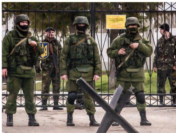
Stämmige russische Elitesoldaten vor einer ukrainischen Garnison. Wie immer treten die Russen schwer vermmummt auf.