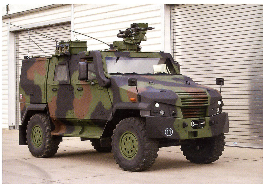
Für die Bundeswehr liefert Mowag dank einem neuen Vertrag weitere 76 EAGLE V.

Dank beachtlicher Nutzlastreserven und dank modularer Rüstsätze können die hochgeschützten Führungsfahrzeuge für unterschiedliche Missionen konfiguriert