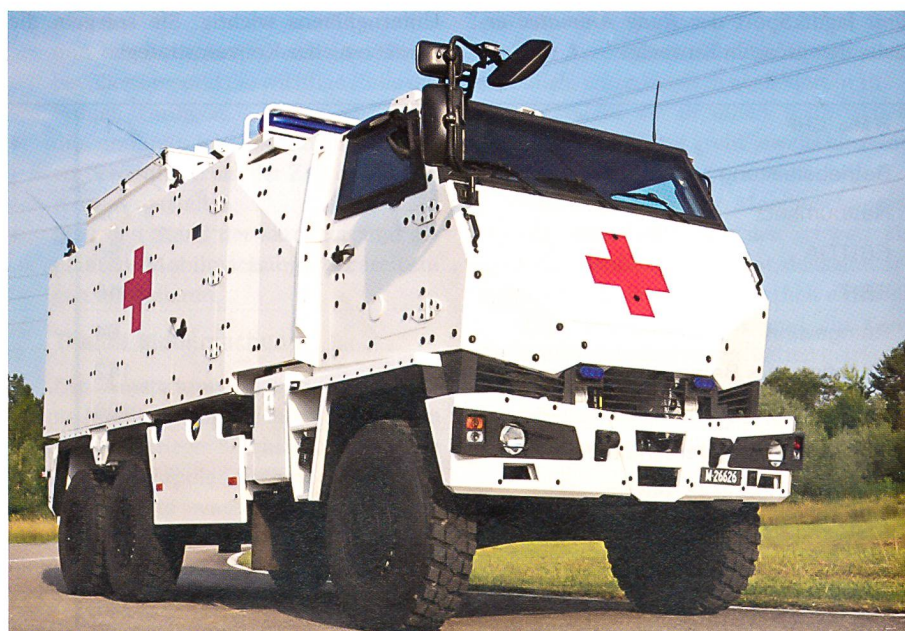
Das Geschützte Sanitätsfahrzeug (GSANF), ein DUR0, wurde in der Armee eingeführt.