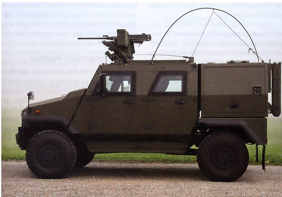
Der EAGLE EOR (Explosive Ordnance Reconnaissance) ist bei KAMIR schon im Einsatz.

Um die Einsatzbereitschaft und den Schutz der Soldaten zu maximieren, sind sämtliche Fahrzeuge mit einer Klimaanlage und einer ABC-Schutzbelüftungsanlage ausgestattet.