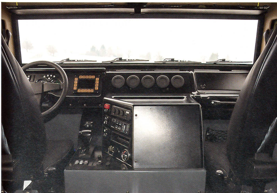
Der Blick in den modern und übersichtlich gestalteten Innenraum des Mowag EAGLE.

Ebenfalls von der Firma Mowag kommen die Fahrzeuge der DURO-Familie. Oft genannt und gezeigt wird seit einiger Zeit das bullige Geschützte Mannschaftstransportfahrzeug GMTF der Schweizer Armee. Bekannt ist auch das Geschützte Sanitätsfahrzeug GSANF, ebenfalls im Einsatz mit der Schweizer Armee.