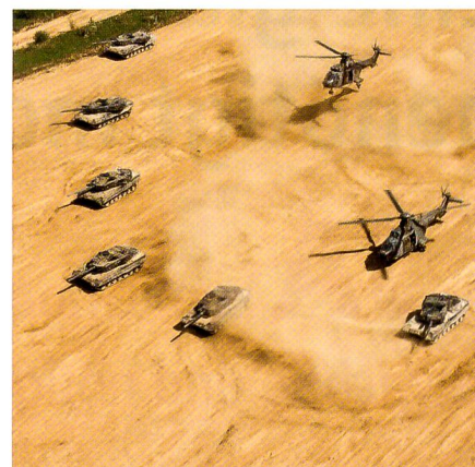
Jede Armee braucht Panzer