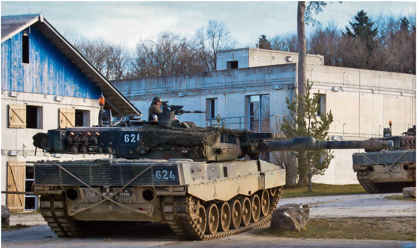
Panzer 87 Leopard WE eingesetzt im Nalé (Bure).

griffes der eigenen Truppen zu machen. Analoges gilt für den Schiesskommandanten. Dieser muss insbesondere das Feuer aller Bogenschusswaffen (inklusive der zu beschaffenden [Panzer-]Minenwerfer) sowie auch das Feuer zugunsten der Bodenverbände aus der Luft (Close Air Support) ins Ziel lenken sowie koordinieren können.