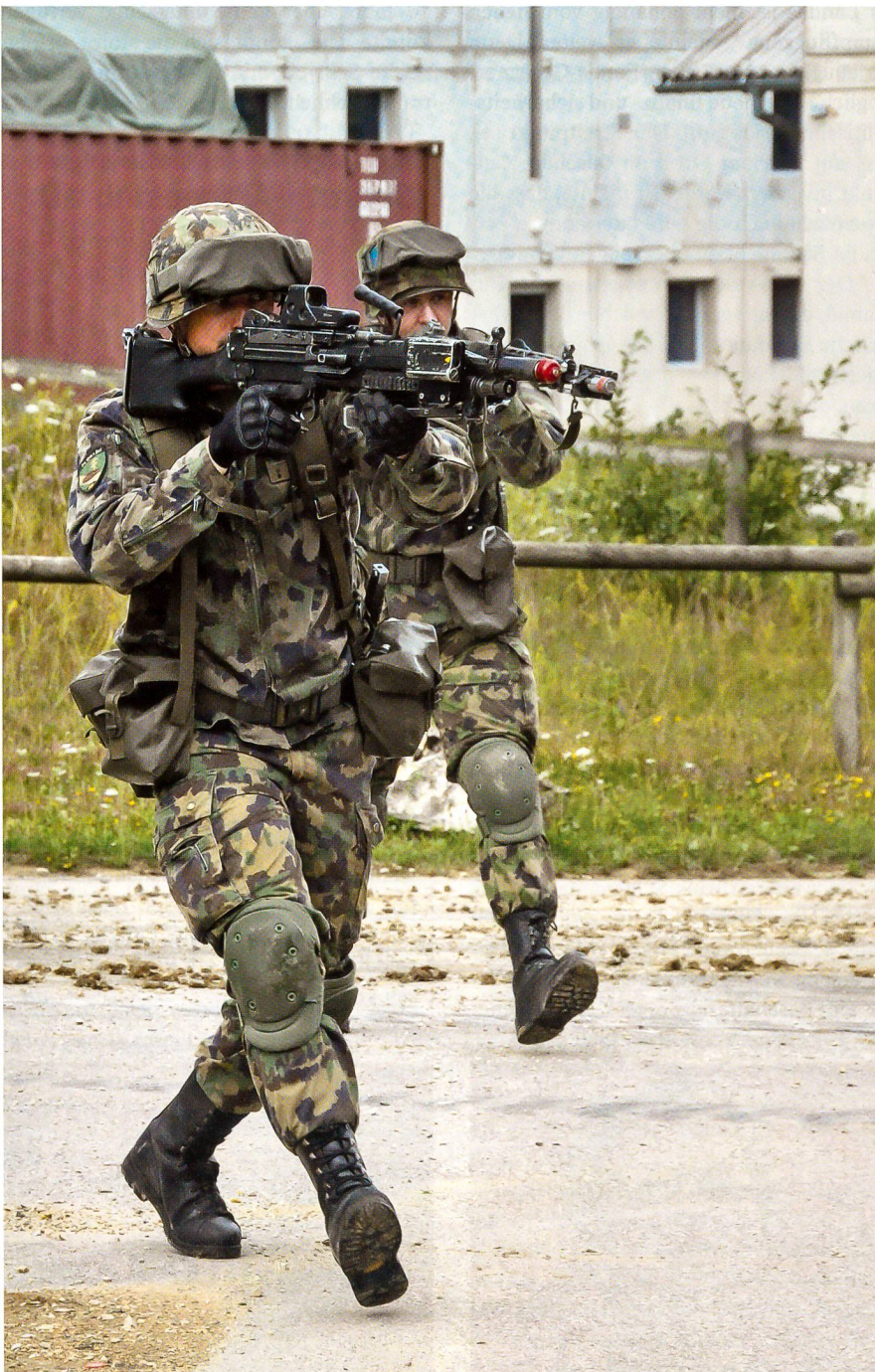
Panzergranadiere im Häuser- und Ortskampf.