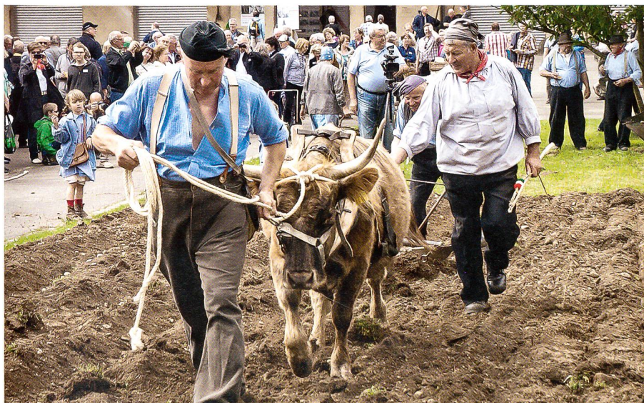
Sehr realistisch werden die Arbeitsmittel von 1914 gezeigt.