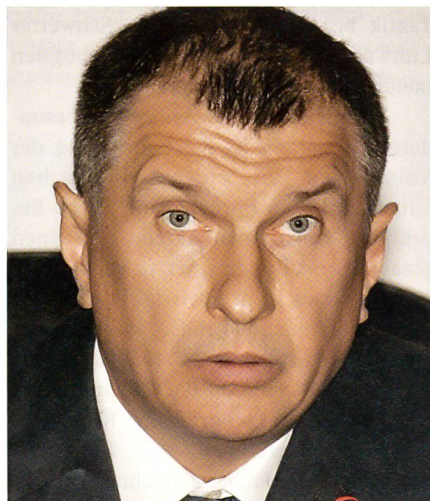
Igor Setschin, CEO Rosneft , den viele für den zweitstärksten Russen halten.