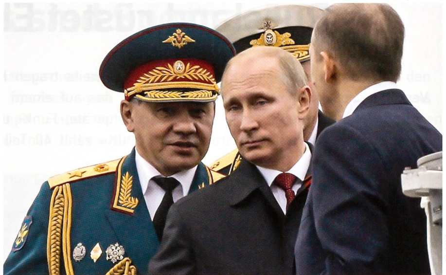
Verteidigungsminister Sergej Schoigu mit dem Präsidenten Wladimir Putin.