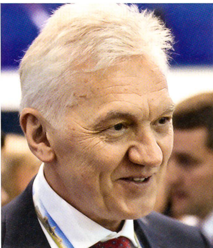
Gennadi Timtschenko, bis vor kurzem Chef des Rohstoffkonzerns Gunvor .

Sein Clan umfasst zwei Wirtschaftsgrossen: Alischer Usmanow, den Direktor der Holding Gasprominvest , und Alexej