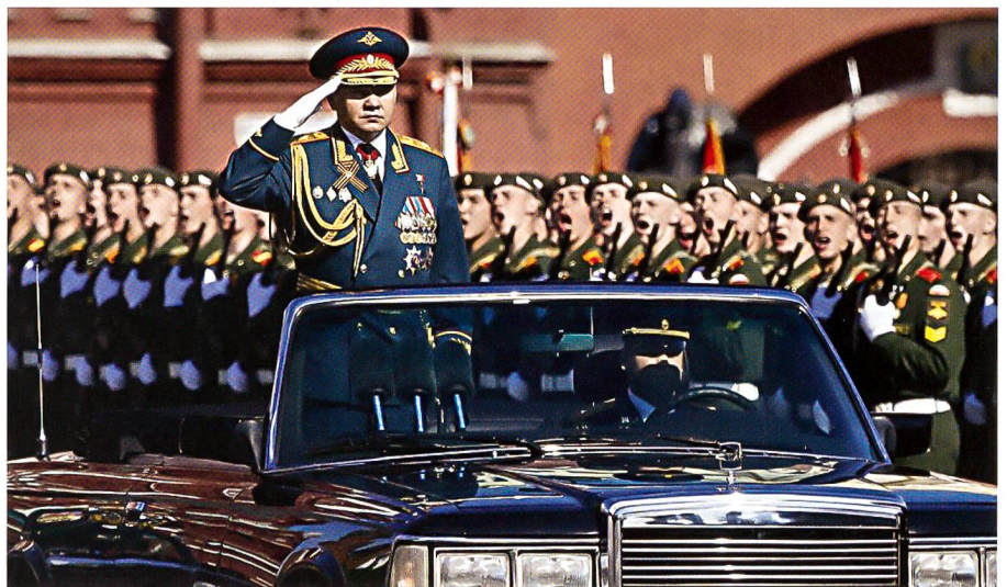
Sergej Schoigu am 9. Mai 2014 an der Siegesparade für 1945 auf dem Roten Platz.

Energiesektors. Gazprom und Rosneft sind beherrschende Konzerne; ohne das Geld aus dem Gas- und dem Öl-Geschäft geht nichts.