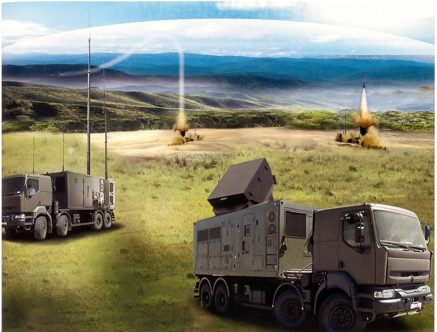
Die Darstellung zeigt die Feuereinheit SAMP/T, die für den Raumschutz auf mittlere und grosse Entfernung eingesetzt wird.

in der Bundeswehr eingeführtes und funktionierendes System, bekannt unter dem Namen Mantis.