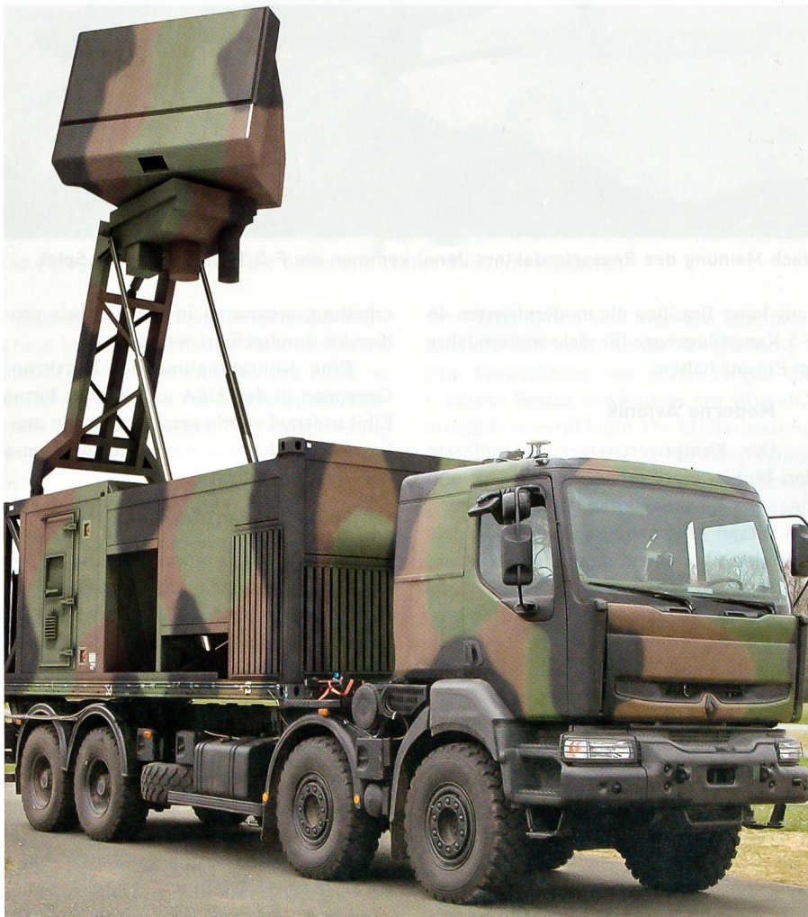
Das Multifunktionsradar CM200 dient der Luftraumüberwachung auf mittlere Distanzen bis 250 Kilometer und als Feuerleitradar.

Für die kurzen Distanzen verfüge Rheinmetall Air Defence über ein bereits