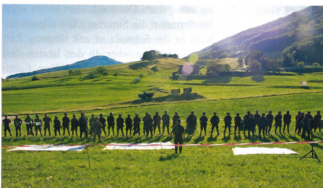
Übungsende: Caduff spricht dem Zug seine Anerkennung aus.