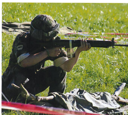
Von jedem wird Eigendisziplin erwartet.