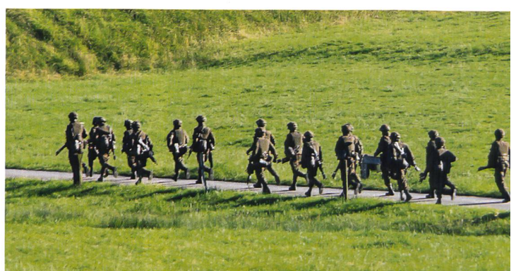
Im Laufschrift verschiebt sich der Zug in Richtung Gehen.