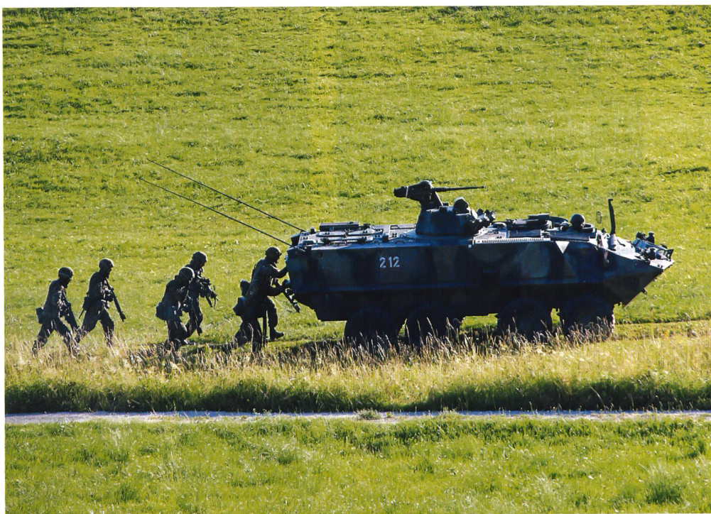
Vorstoss im Gegenlicht: Eine Gruppe Infanteristen im Schutz des Radschützenpanzers.

Damit überhaupt von Seiten der Infanterie Gewalt verhältnismässig angewendet werden dürfe, so Niedermann, müssten die Akteure zuerst identifiziert werden: «Dies stellt die Hauptherausforderung im heutigen Einsatzumfeld dar. Wir stehen nicht mehr einem klar erkennbaren Gegner in Uniform gegenüber.» Der heutige Gegner