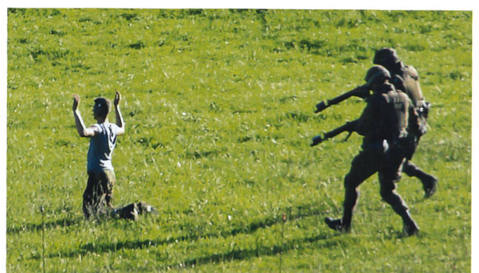
Auf freiem Feld: Ein Einzelakteur wird gefangen genommen.