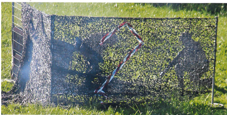
Wie vom Zugführer geplant, nimmt der Halbzug 34 das Objekt 2.