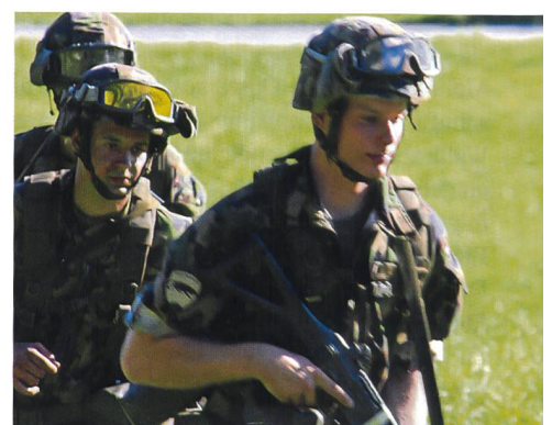
Durchdiener sind körperlich topfit.