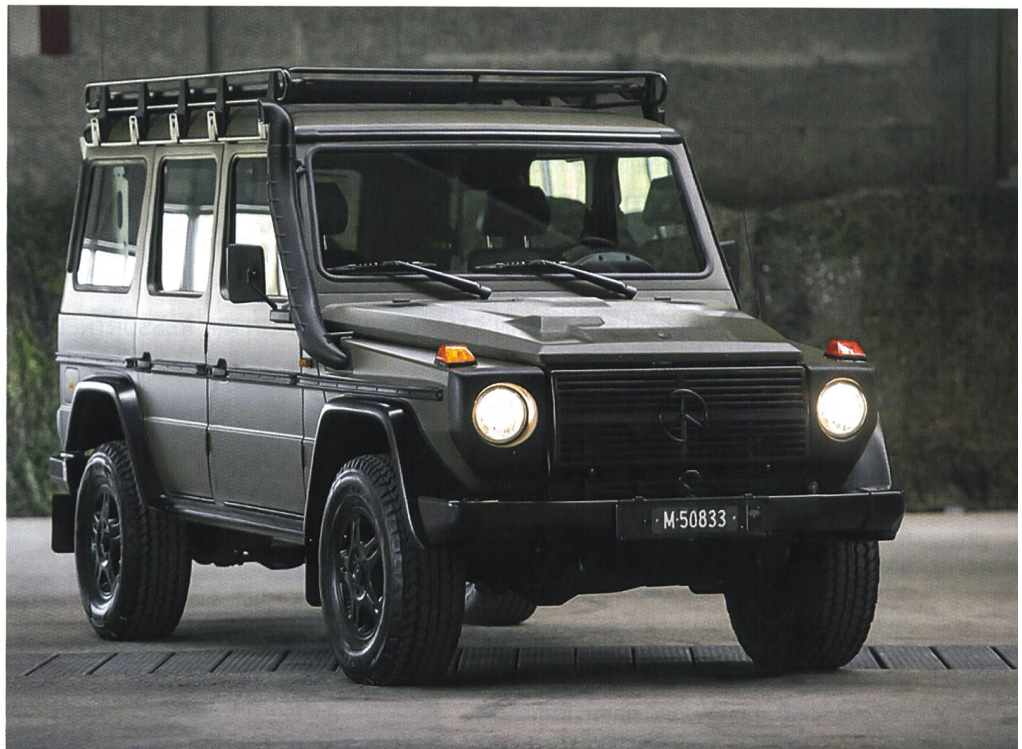
Vom Mercedes-Benz G 300 CDI 4x4 sollen 879 Fahrzeuge beschafft werden.

automatischen Erfassung von anderen Luftfahrzeugen. Es leitet ein Ausweichmanöver ein, wenn sich ein Flugzeug auf Kollisionskurs zur Drohne befindet.