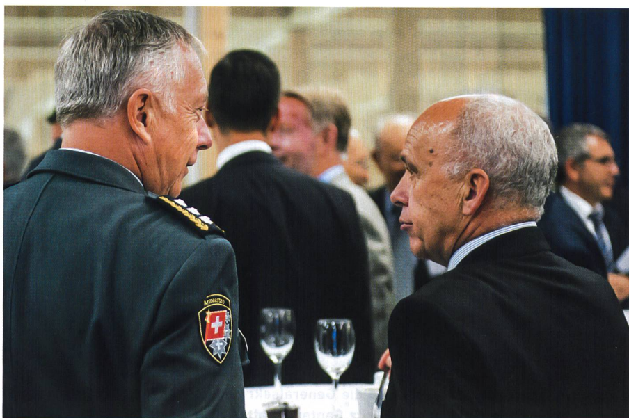
Bundesrat Ueli Maurer im Gespräch mit Korpskommandant André Blattmann.

Im Anschluss an den offiziellen Teil in Stans begaben sich die etwas über 100 anwesenden Mitglieder auf den Katamaran der Schifffahrtsgesellschaft des Vierwaldstättersees. Das schöne Sommerwetter, die Fahrt auf dem See, Speis und Trank ermöglichten einen gelungenen Abschluss des 60-Jahr-Jubiläums der Gesellschaft. ✚