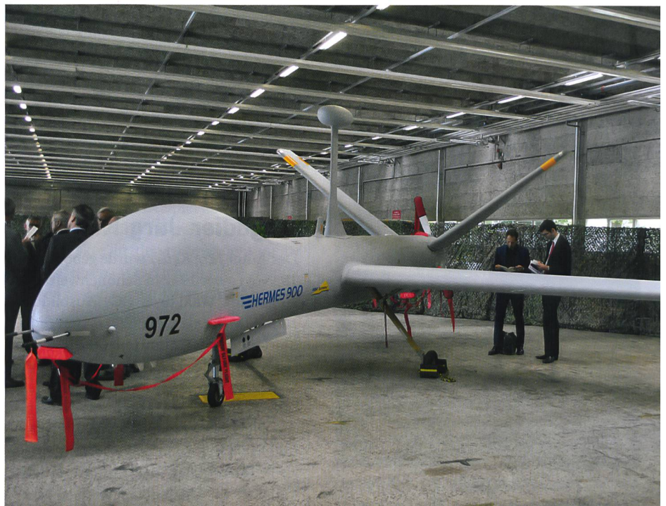
Die neue Drohne stammt von der Firma Elbit Systems Ltd. Sie heisst Hermes 900 HFE.

Das ADS 15 dient dem Erhalt der Fähigkeit zur Lage- und Zielaufklärung nach der Ausserdienststellung des ADS 95. Das abzulösende ADS 95 ist gut 20 Jahre alt und entspricht dem Technologiestand der Acht-