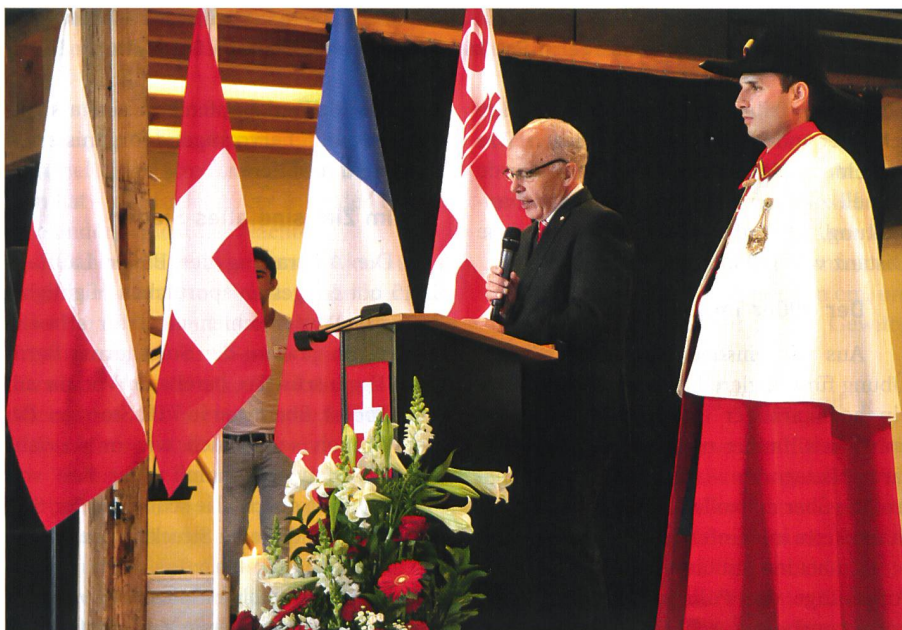
Für Bundesrat Maurer war es ein persönliches Anliegen, an der Feier teilzunehmen. Er würdigte die Ereignisse vom 1940 in bewegenden Worten.

1353 Hektaren Wald wurden gerodet, 1000 Hektaren Brachland urbar gemacht und 7000 Tonnen Steinkohle gefördert. Für die Landesverteidigung wurden 10 000 Arbeitstage, für die Landwirtschaft rund eine Million Arbeitstage geleistet. ✠