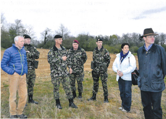
Im modernen GAZ West von Bure werden Gäste empfangen.