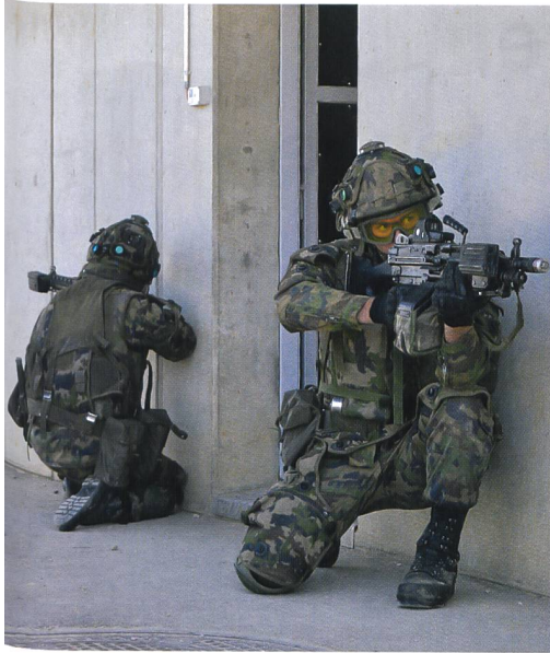
Im Nalé: Panzergrenadier im Ortskampf.