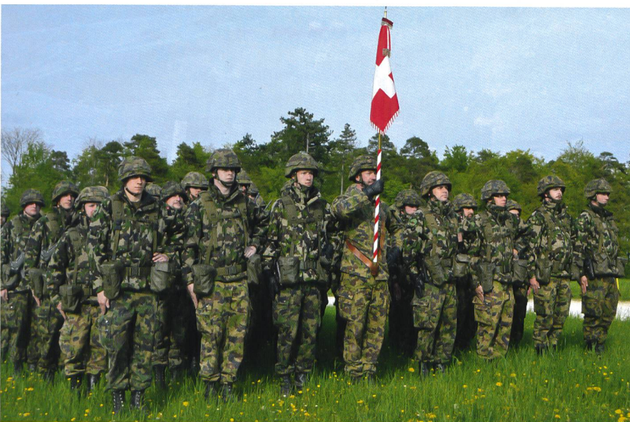
Pz Bat 13: Die Standarte, das Symbol für das Bataillon als Schicksalsgemeinschaft.