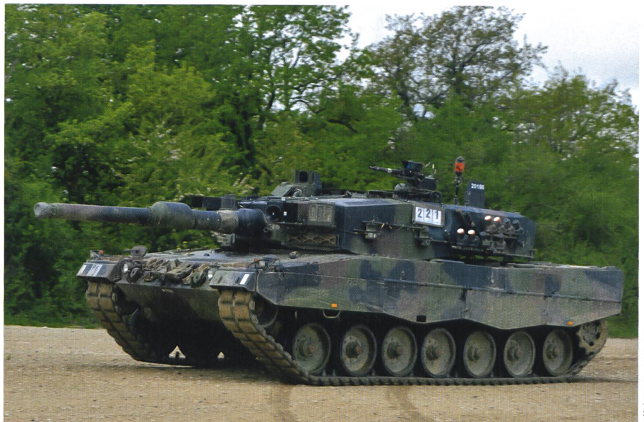
Der erste Kampfpanzer Leopard des zweiten Zugs der zweiten Kompanie stösst vor.