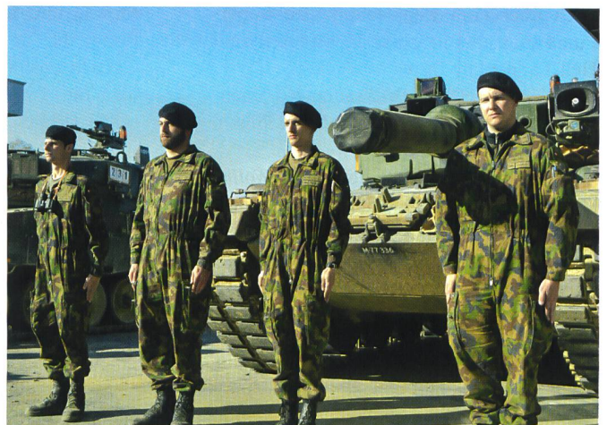
Die tüchtige Vierer-Mannschaft eines Leopard-Kampfpanzers.