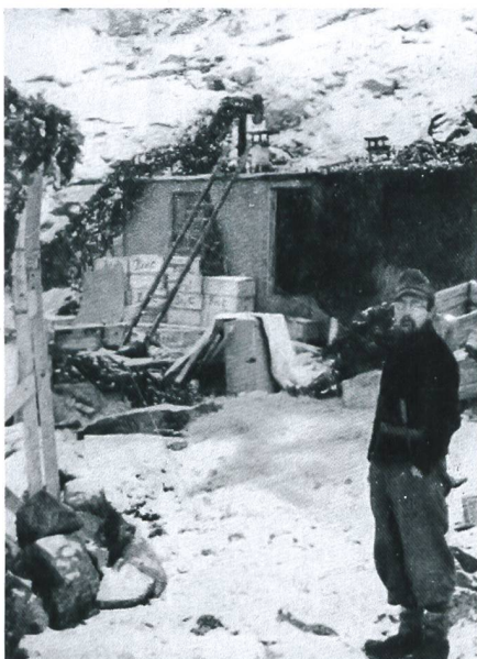
Die Station zu Beginn des Unternehmens.

Der Wettertrupp wird mit Material und reichlich Verpflegung (etwa 6000 Kalorien pro Mann/pro Tag) für rund 18 Monate ausgestattet. Die Menge an Versorgungsgütern ist so gross und umfangreich, dass die Autonomie der Station ohne Einschränkung auf