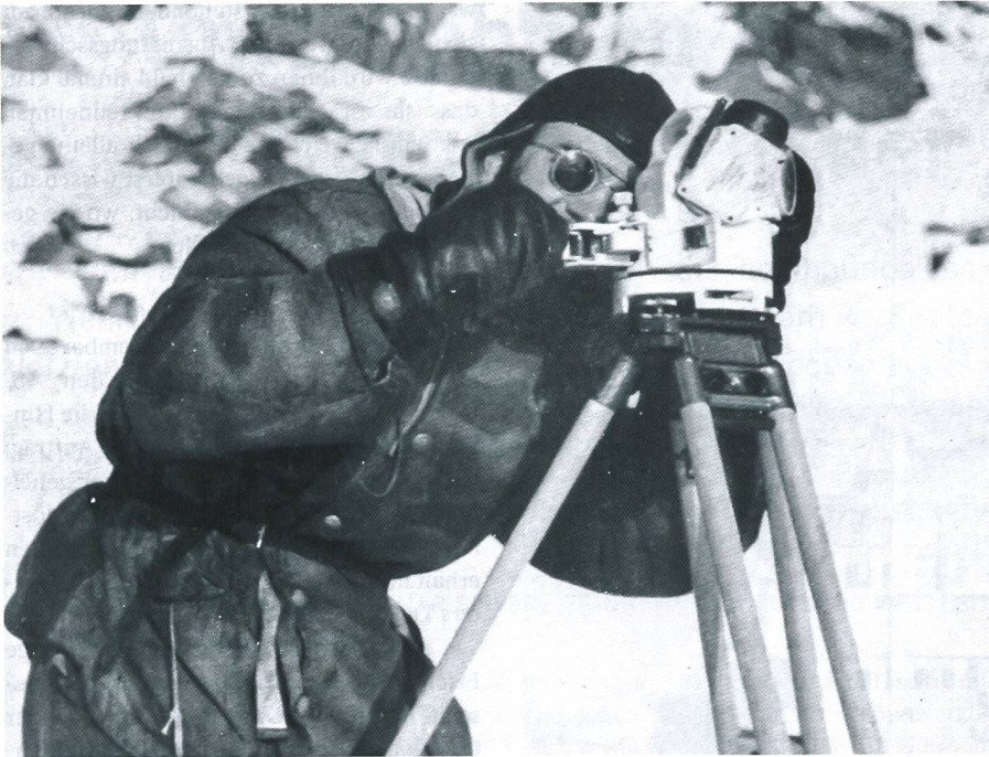
Der Wetterballon wird vom Wetterteam mit einem Theodoliten verfolgt.

Versuch soll schnellstmöglich angegangen werden, denn die Zeit drängt. Die Wetterstation muss vor dem Beginn des arktischen Winters mit der Übermittlung der Wetterdaten beginnen.