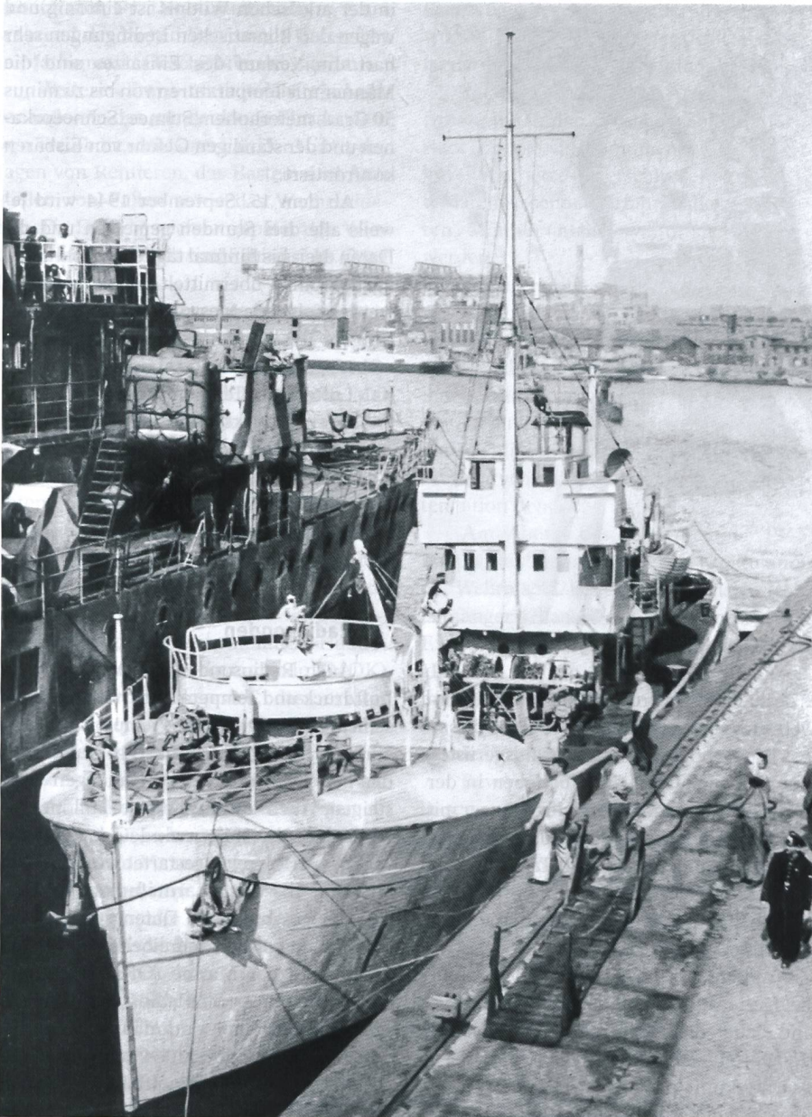
Der ehemalige Fischdampfer «Karl J. Busch» diente als Transportschiff für das umfangreiche Material. Hier bei der Aufnahme von Material in Kiel.

zwei Jahre hätte ausgedehnt werden können. Durch Jagd und das Einsammeln von Treibholz kann die Autonomie der Wetterstation zusätzlich verlängert werden.