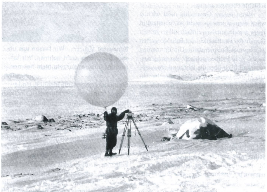
Täglich wurde eine Radiosonde in die Stratosphäre entlassen.

Der Autor, Major Kaj-Gunnar Sievert, hielt sich im April 2013 auf Spitzbergen auf und wurde im Vorfeld seiner Reise auf die deutschen Wetterstationen während des Zweiten Weltkriegs aufmerksam. Ausserdem ist er Verfasser mehrerer Standardwerke zu Sondertruppen.