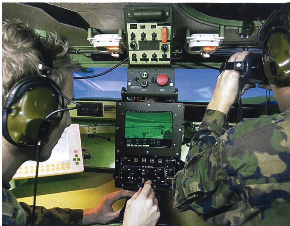
SOGART-Tagung mit über 100 Offizieren: Schulung in den Kampfräumen des ELTAM.

Am Nachmittag hatten die Teilnehmer der SOGART-Herbsttagung die Gelegenheit, im Mechanisierten Ausbildungszentrum in Thun im Rahmen einer Simulationsübung auf dem Elektronischen Taktiksimulator für mechanisierte Verbände (ELTAM) und auf der Elektronischen Schiessausbildungsanlage Schiesskommandant (ELSA SKdt) selbst Hand anzulegen.