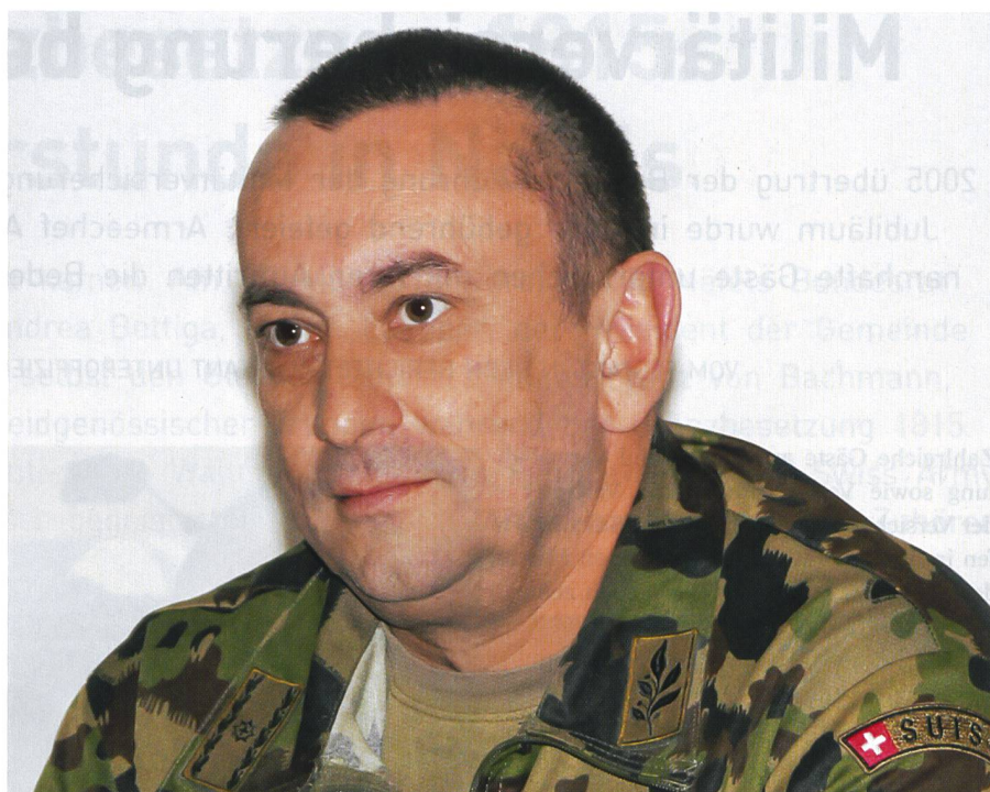
Brigadier René Wellinger: In der Ausbildung auch unkonventionelle Ideen verfolgen.

Den Hauptbeübten (Truppenkörper- und Einheitskommandanten, Truppenkörperstäbe) stehen originalgetreue Kampfraum-Nachbildungen mit einer 360°-Ausensicht und Quadrophonie-Sound zur Verfügung. Das ELTAM-Gelände umfasst 1666 km 2 und erlaubt damit eine effiziente Ausbildung auf Stufe Trp Kö im Gefecht der verbundenen Waffen, wie sie heute auf Waffen- und Schiessplätzen, aber auch abseits von letzteren in der Schweiz nicht sichergestellt werden kann. Haben in der Vergangenheit Panzer-, Infanterie- und Aufklärungsbataillone mit ELTAM trainiert,