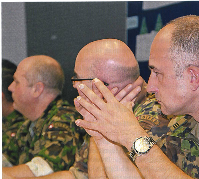
BLAU verteidigt die Schweiz und deren Bevölkerung sehr gut.

die FEV-Fälle häufen, rechnen die Behörden mit einer Flüchtlingswelle.