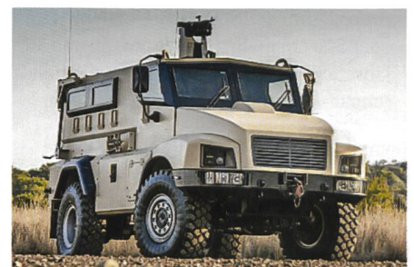
Minengeschützter Personentransporter RG21 von BAE Land Systems South Africa.

Der Antriebsstrang mit einem Turbo-Dieselmotor und einem ZF-Sechsgang-Schaltgetriebe sowie die Elektronik sind von einem Standard-Iveco-LKW übernommen. Die Spitzengeschwindigkeit liegt bei 110 km/h. Das elektrische System wird über ein digitales CANBUS-System kontrolliert. Im Innenraum ermöglicht ein