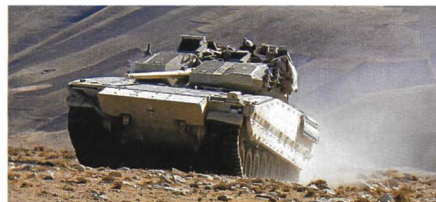
Norwegischer CV90 in Afghanistan.

2012 war BAE Systems mit der Lebensdauererweiterung und Leistungssteigerung von insgesamt 103 und dem Neubau von 41 CV90 beauftragt worden. Den ersten Infanteriekampfwagen hatte BAE Systems im Februar 2014 ausgeliefert. Neben 16 Pionierpanzern und 74 Infanteriekampfwagen umfasst der 630-Millionen-Euro-