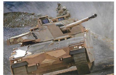
Neues elektronisches Abwehrsystem LEDS-50 Mk2 von Saab.

Die Version Mk2 kennt die Kodierungen der neuesten Laserbedrohungen, denen über eine Bibliothek Abwehrmassnahmen zugeordnet werden. Darüber hinaus wird die Besatzung akustisch gewarnt. Mit