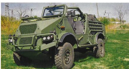
Special Operations Vehicle SOV von KMW.

Besonderheit ist ein faltbarer Überrollbügel, der die Vorbereitungszeit für den Lufttransport z. B. in Helikoptern wie CH-47 Chinook oder CH-53 Sea Stallion auf