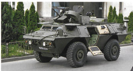
Bulgarischer Textron ASV.

Bulgarien hatte bereits 2008 sieben ASV erhalten, die zum Teil in Afghanistan im Einsatz waren. ASV sind seit 1999 vorwiegend bei der US-Militärpolizei im Ein-