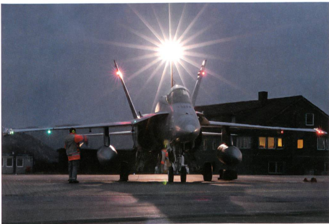
Im gleissenden Flutlicht machen Maintenance-Spezialisten der Luftwaffe einen F/A-18C für einen Trainingseinsatz bereit.