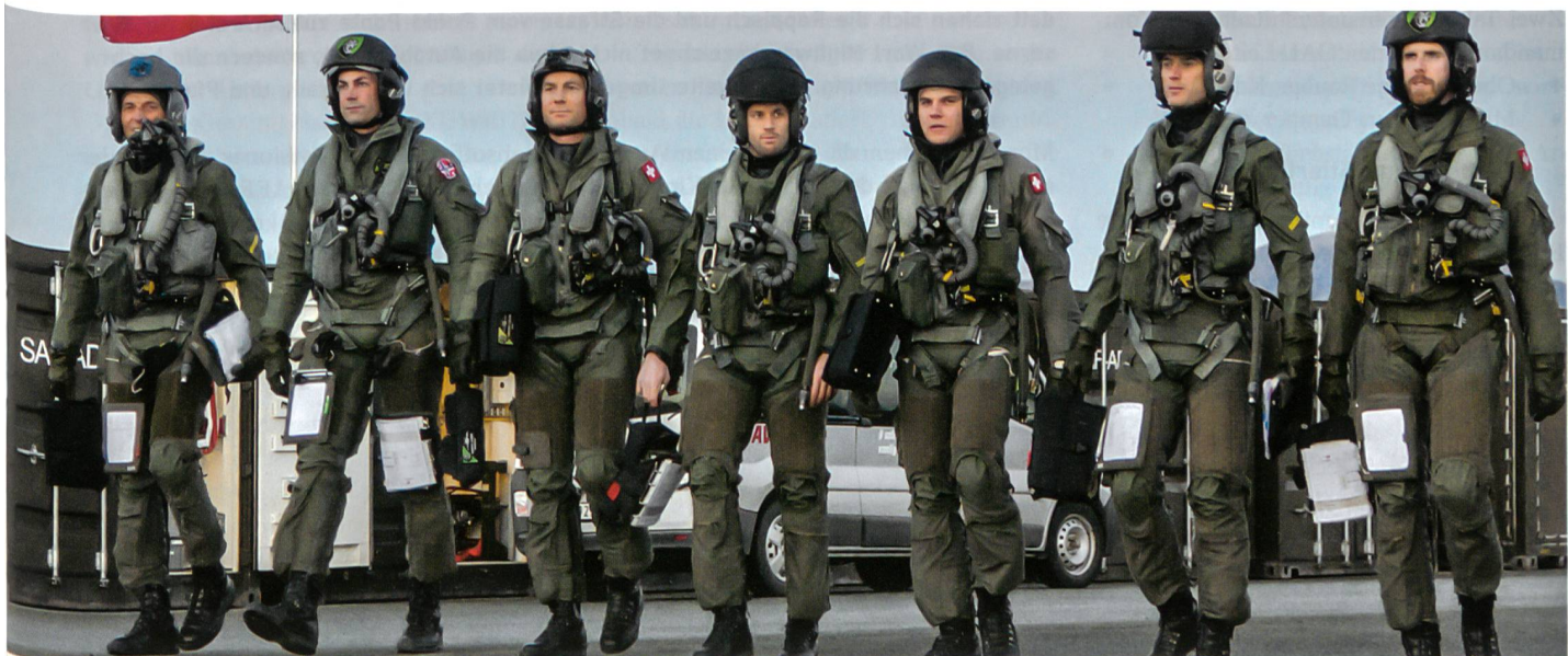
Eingepackt in überlebenswichtige Trockenanzüge begeben sich die Piloten für einen Einsatz über dem Nordmeer zu ihren Kampffjets.