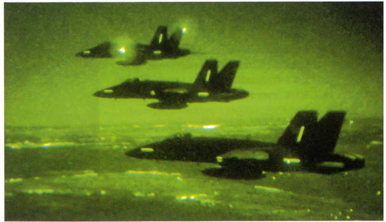
Selbst in den brandschwarzen Nächten setzen die Night-Vision-Goggles das Restlicht in ein fast taghelles Grünbild um.