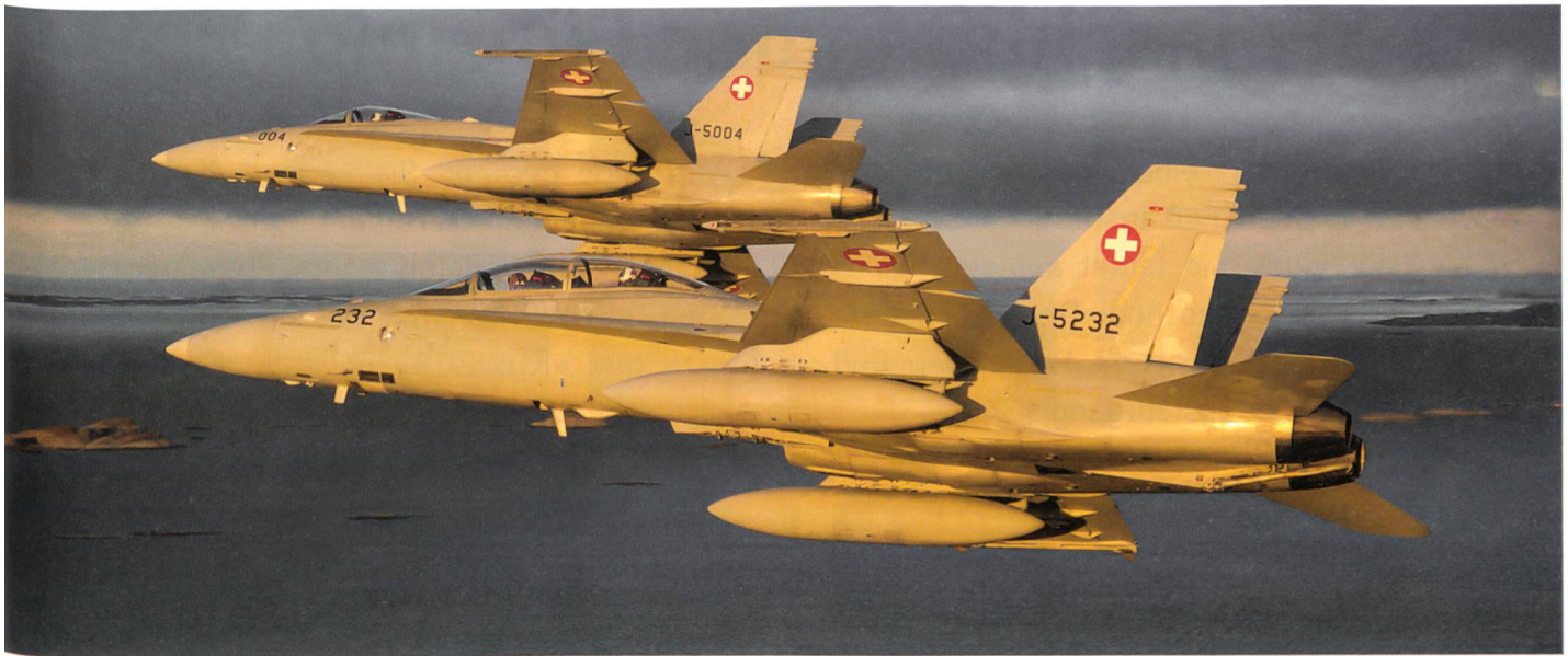
Eine F/A-18D und eine F/A-18C kehren im wärmenden Nachmittagslicht nach einer Luftkampfübung über dem Meer nach Ørland zurück.