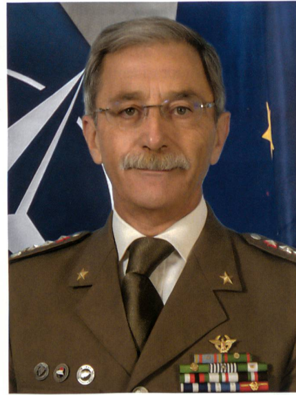
General Leonardo di Marco führt das Joint Force Command Neapel der NATO.