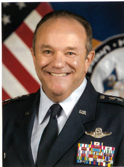
General Philip M. Breedlove ist in der NATO der Oberbefehlshaber Europa.