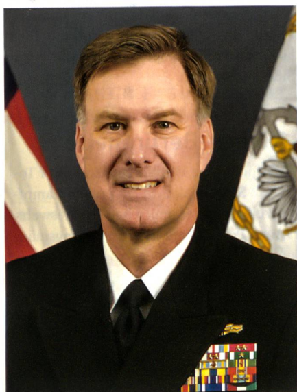
Admiral Mark E. Ferguson führt die amerikanischen Seestreitkräfte Europa.

Im September 2014 hat der NATO-Gipfel in Wales dem militärischen Befehlshaber einen Readiness Action Plan (Plan