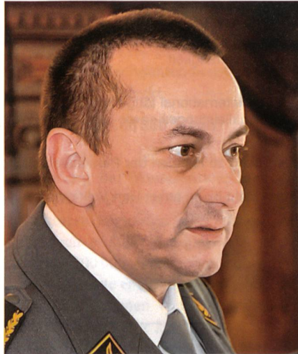
Wellinger: Kampf im überbauten Raum.

Wellinger regt an, die Schiesskommandanten mit den Aufklärern und Scharfschützen zu vereinen und Joint Fire Support and Reconnaissance Teams zu bilden. Dazu