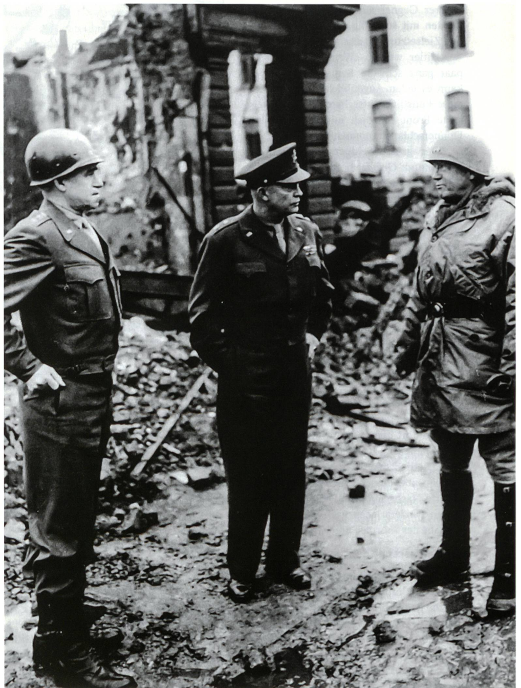
Bradley, Eisenhower und Patton in den Ruinen der Ardennenstadt Bastogne.

Der Mann, der in Ziegenberg vor seinen Zuhörern sass, bot eine jämmerliche Figur. General Hasso von Manteuffel erinnerte sich später an die «gebeugte Gestalt mit blassem, aufgedunsenem Gesicht, im