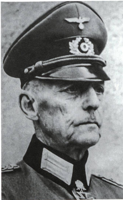
Feldmarschall Karl Rudolf Gerd von Rundstedt, Oberbefehlshaber West.