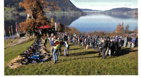
Gewehrscützen hoch über dem Agerisee.