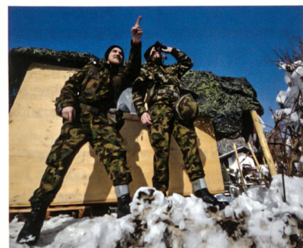
Spannend ist es, am WEF zu dienen.