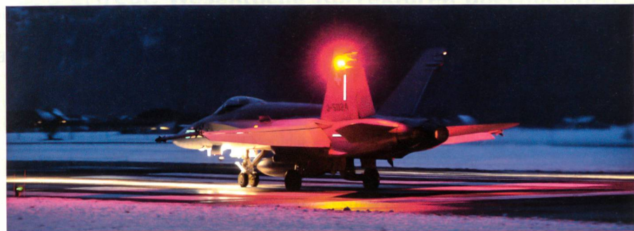
Ohne den Schutz, den die Luftwaffe rund um die Uhr gewährt, ist kein WEF denkbar.