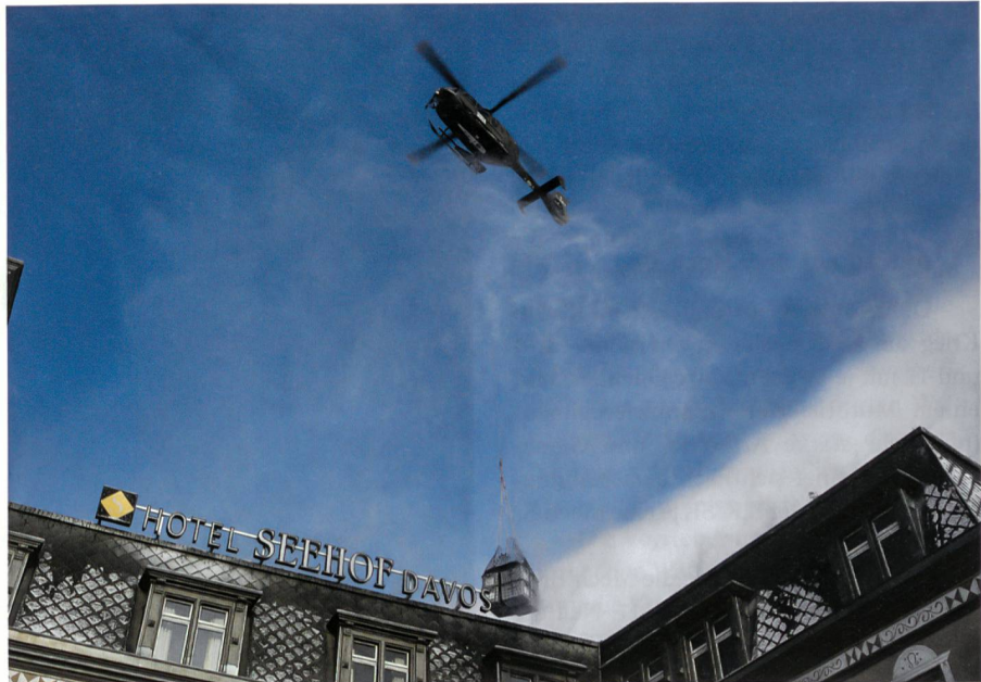
Im Hotel Seehof, Davos, nächtigen traditionell Israeli und Jordanier.