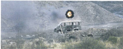
Testschuss mit der Airburst-Munition.

Die Bundeswehr beschafft eine neue 40mm × 53-Munition mit Luftsprengpunkttechnologie aus dem Hause Rheinmetall. Die 40mm × 53-Airburst-Munition (ABM) ist nicht nur von der Bundeswehr, sondern