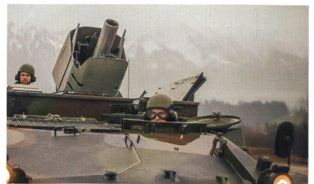
Modernes Mörsersystem RUAG COBRA.

Ein entscheidender Vorteil der COBRA gegenüber anderen Mörsersystemen ist ihr elektrischer Antrieb. Dieser sorgt dafür, dass der Mörser während eines langen Kampftages stets schnell und genau in Schussposition gebracht und gehalten werden kann. Bei alternativen Systemen hingegen erfolgt die Steuerung zum Teil noch hydraulisch. Demzufolge sind die Richtbewegungen schwerfälliger und die Zielerfassung ungenauer. Die Elektronik der COBRA ist hochmodern. Sie ist mit einer inte-