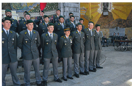
Das Rekrutendetiachement Lourdes mit Brigadier Germaine Seewer, J1 der Armee.