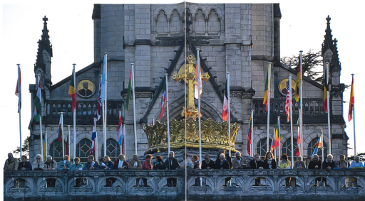
Die Fahnen von 34 Nationen schmückten den Vorplatz der Basilika von Lourdes.

Es wird gemunkelt, dass auch die eine oder andere Liebesgeschichte Armeeübergreifend hier ihren Anfang genommen hat, doch das untersteht dem Seelsorgegeheimnis des schreibenden Asg. ☑