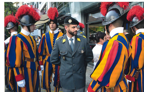
Ein Schweizer in Ausgangsuniform mit Kameraden der Schweizergarde in Galauniform.