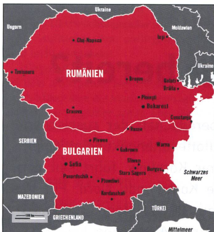
Rumänien (20,1 Mio. Einw.) misst 238 391 km 2 , Bulgarien (7,3 Mio.) 110 994 km 2 .

für eine EDRE alarmiert und planen deshalb jetzt einen Absprung. Fernandez fügte hinzu, mit diesen überraschend angesetzten Übungen werde die Brigade in ständiger Alarmbereitschaft gehalten.