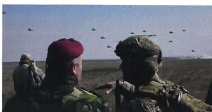
Ein Rumäne und ein Amerikaner beobachten die Landung.

Die Aktion in Smardan war der offizielle Start der Operation «ATLANTIC RESOLVE» in Rumänien und Bulgarien; damit wurde die Reihe der Manöver fortgesetzt, die im April 2014 in Estland, Lettland, Litauen und Polen begann und mit der die USA ihren NATO-Verbündeten angesichts der russischen Vorstösse in der Ukraine ihren Beistand beweisen wollen.