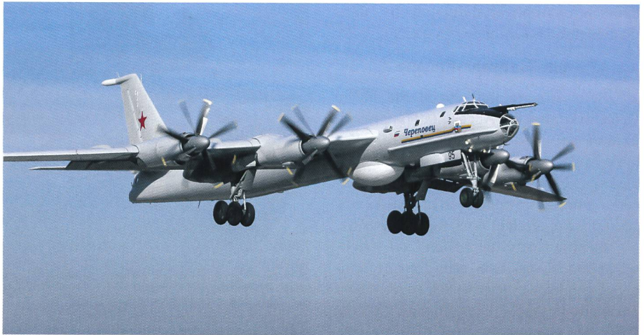
Seltenes Bild: Der Seeaufklärer Tu-142 beim Landeanflug.