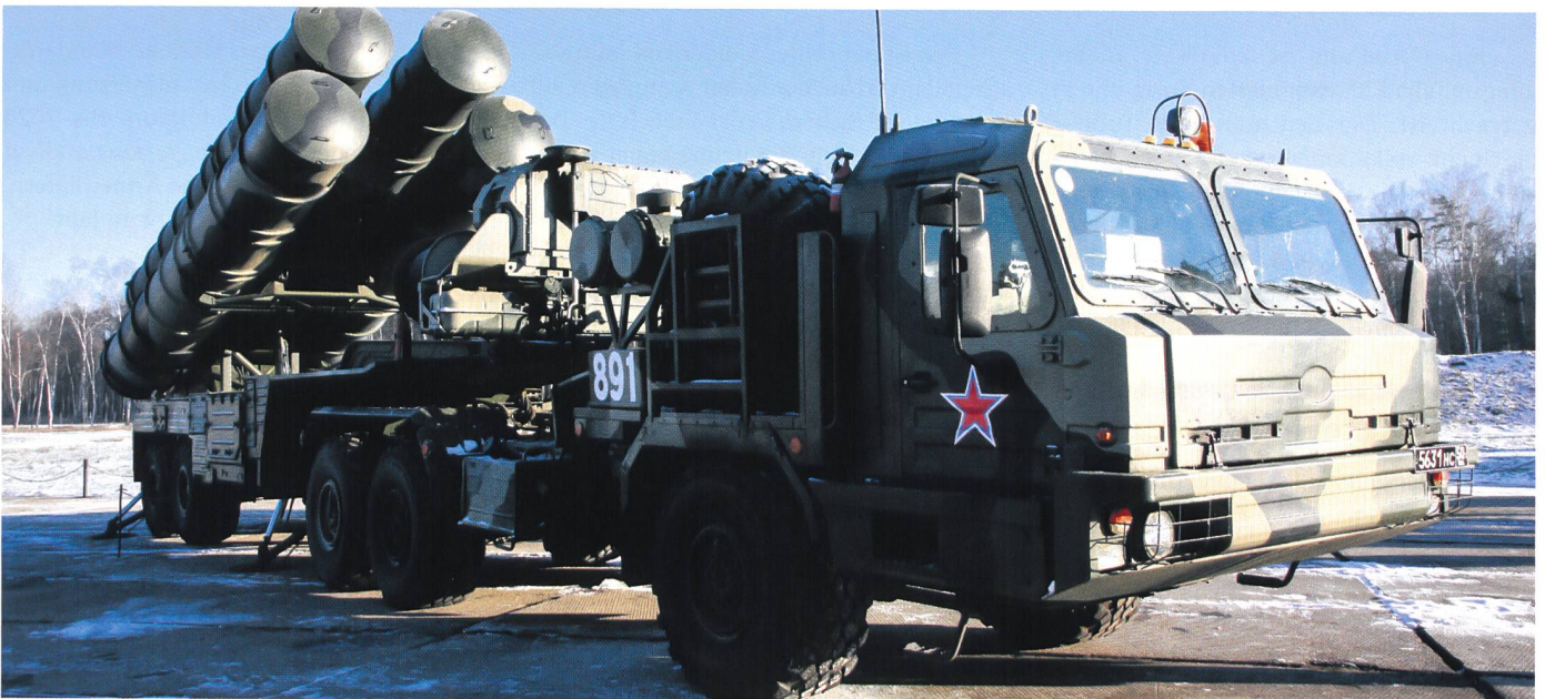
Schon am 23. März 2015 verstärkte die russische Führung die Fliegerabwehr auf Kola mit einem Regiment S-400 TRIUMF.