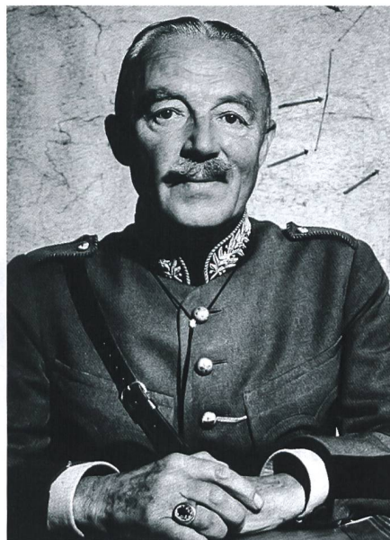
General Henri Guisan, Oberbefehlshaber der Schweizer Armee von 1939–1945.