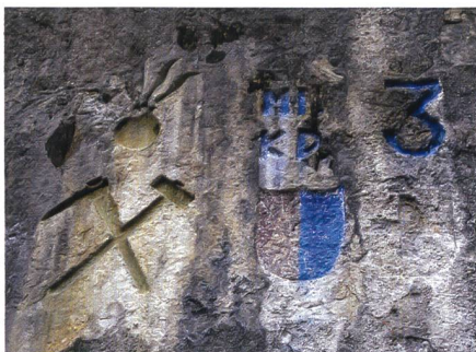
Das war eindeutig eine Luzerner Truppe.

verewigt. Durch das Wasser, das bei nasser Witterung über den Felskopf fliesst, wurde eine Kalk-Sinterschicht auf die Felszeichen getragen, so dass die Zeichen je länger je mehr unkenntlich wurden.