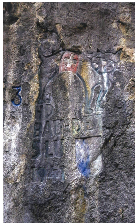
Die Katze erinnert an die Katzenstrecker.

Für die Restaurierung der Katze, der Wappen und Inschriften konnte ein be-