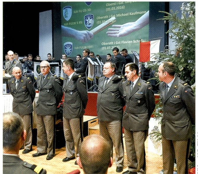
Ehre, wem Ehre gebührt: Sie wurden von Baumann geehrt.