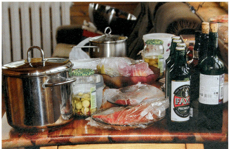
Den kalten Winter nutzen: Die ungeheizte Veranda der Datscha dient als Kühlschrank.

Real jedoch nimmt sich das Szenarium aus, wonach sich Russland an seiner Militarisierung und Hochrüstung überhebt. Gelingt es Putin nicht, die Sanktionen zu lo-