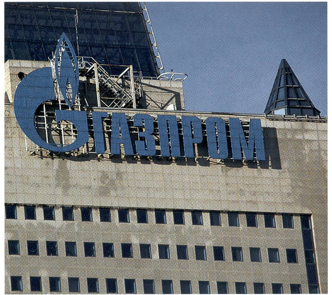
Leidet unter Sanktionen: Das Hauptquartier von Gazprom.