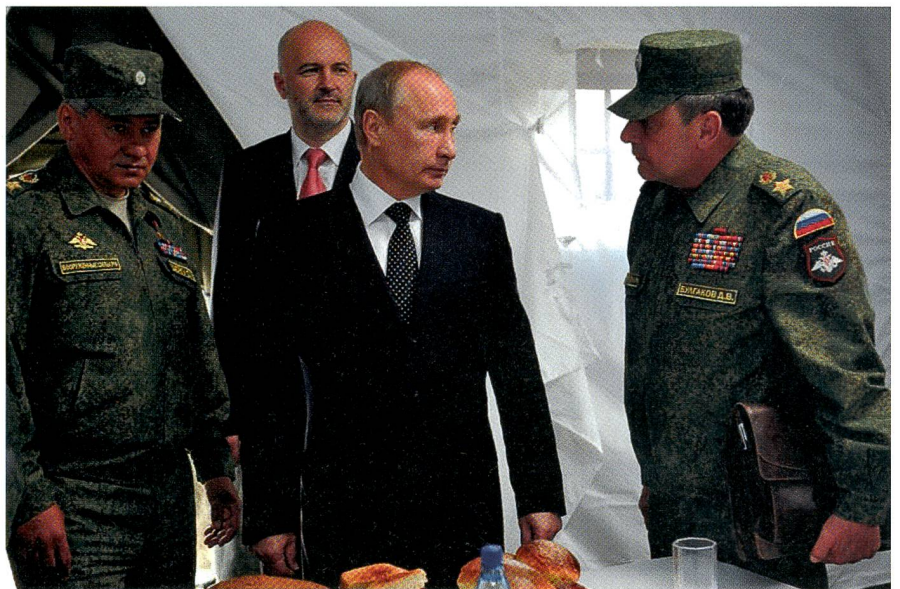
Verteidigungsminister Shoigu, Präsident Putin, stv. Verteidigungsminister Bulgakow.

Noch einmal schaltet der Sender direkt nach Syrien: Su-24, Su-25 und Su-34 schrauben sich schwer bewaffnet in den Himmel. Jetzt kommen die obligaten Trefferbilder, natürlich akkurat, ohne Kollateralschaden. Und dann landen die Helden –