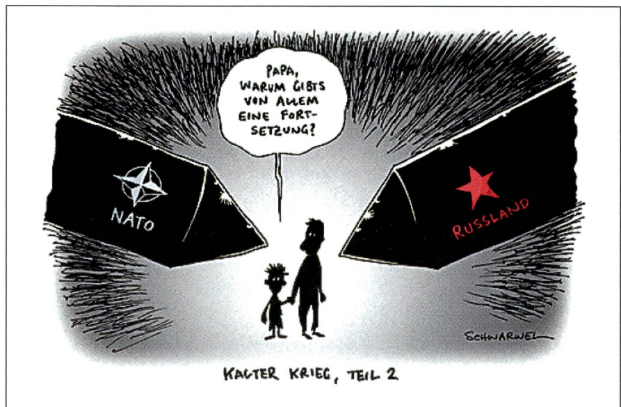
Eine Karikatur, die in Russland Beachtung findet: Kalter Krieg, Teil 2.

gierung bekannt, dies sei dann Unsinn: Man habe keinerlei Trümmer gefunden.