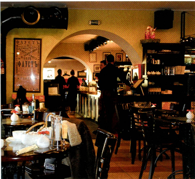
Trotz Sanktionen: Schmuckes Restaurant in der Innenstadt.