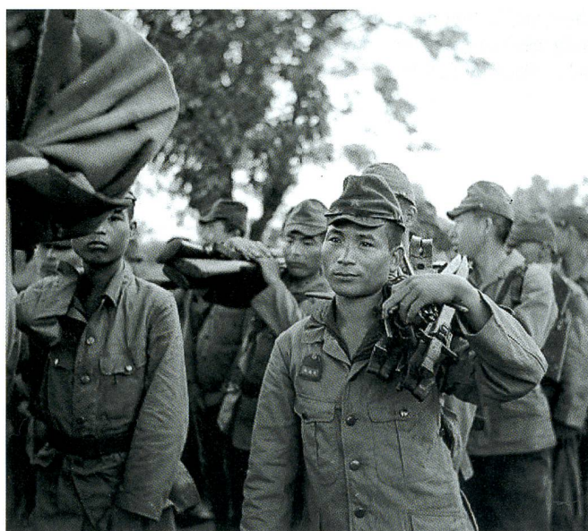
Gefangene Japaner aus der 52. Division nach der Kapitulation.

heit ( Flying Tigers mit P-40-Jägern), die schon vor Pearl Harbor für den Einsatz zugunsten der Chinesen aufgestellt worden war.