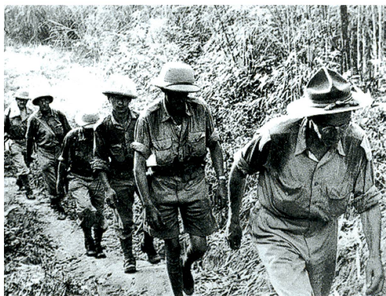
Burma: Alliierte Truppen in beschwerlichem, heissem Aufstieg.