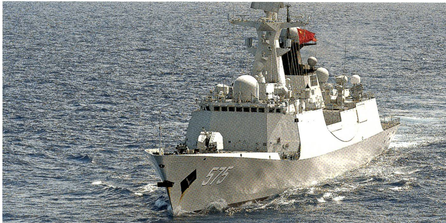
Oberst i Gst Kürsener: Ein kritischer Blick aufs Südchinesische Meer – Seiten 44–47.