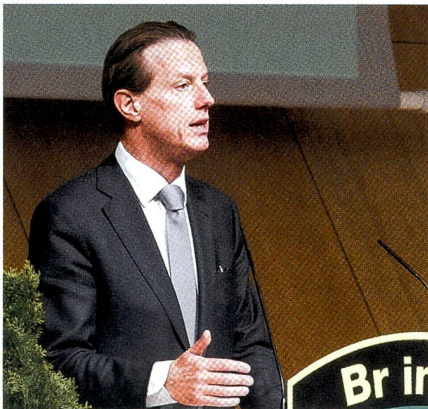
Nationalrat Christian Lüscher, Genf: «Eine gute Armee braucht Ressourcen.»

reit ist, sein Leben einzusetzen – und auf der anderen Seite unter paradiesischem Himmel der Bürger, der von einem Engagement von zweifelhaftem Mehrwert für die Gesamtheit profitiert, das ihm im Vorbeigehen erlaubt, seinen Lebenslauf zu verbessern.»